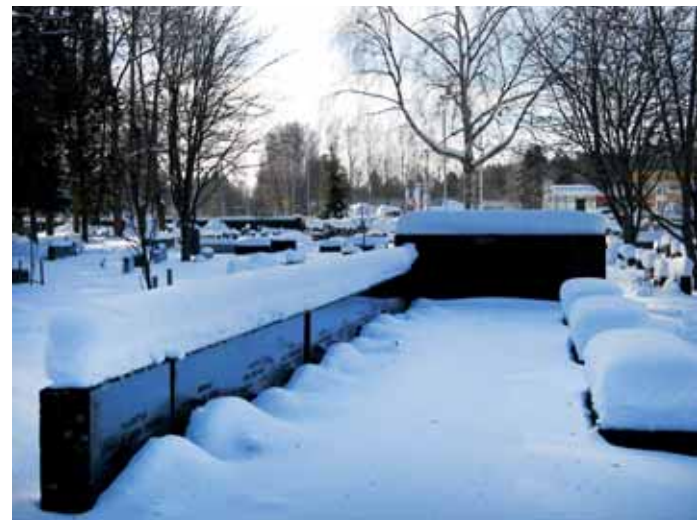
■ Neljäntoista Rosenlewin työntekijän viimeinen leposija.

kirkko valmistui 2002, ja erityisesti kesäisin kirkkoon on tutustunut tuhatmäärin kiinnostuneita. Sekä kirkko että Käppärän hauta-