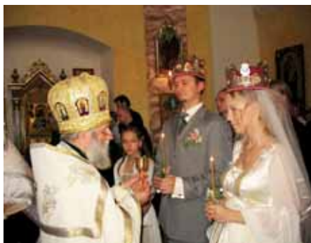
■ Avioliiton mysteeriö on ortodoksinen perheen perusta.

Ortodoksinen kirkko pitää perhettä suuressa arvossa. Vanhempien vastuullisena tehtävä on johdattaa lapsensa kirkon yhteyteen. Jokainen äiti ja isä haluaa, että hänen lapsensa olisi onnellinen ja tahoo tehdä parhaansa lapsensa hyväksi. Suurempaa lahjaa vanhemmat eivät voi lapsellensa antaa kuin sen, että tuovat hänet kastettavaksi. Pyhässä kasteessa lapsi liitetään pelastavaan yhteyteen Kristuksen kanssa. Kasteen jälkeen toimitettavassa voitelun mysteeriössä hän saa Pyhän Hengen lahjat sielunsa ja ruumiinsa siunaukseksi ja pelastukseksi. ▶