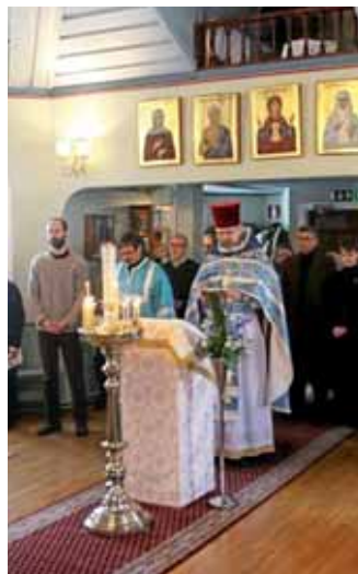
■ Tiistaiseuran kirkkopäivää vietettiin Imatralla 2.2. Jeesuksen temppelin tuomisen päivänä 7.8.