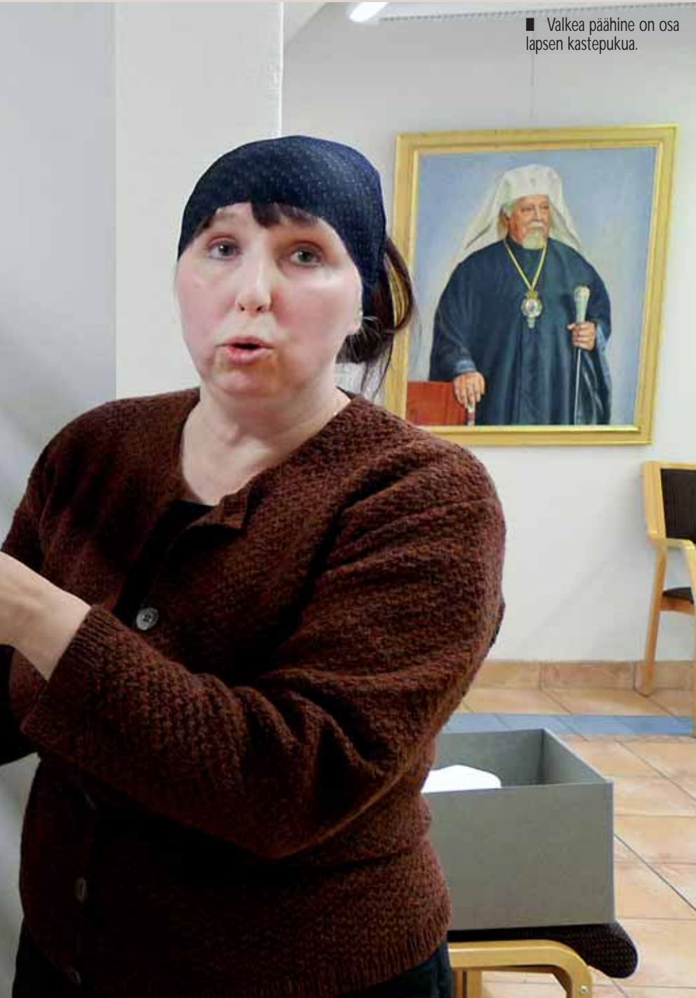
■ Valkea päähine on osa lapsen kastepukua.

– Murheen kokemus on silloin suuri ja rannaton. Ei ole mitään muuta kuin tieto poismenosta. En pysty puvuillani millään täyttämään tätä surun laajuutta,