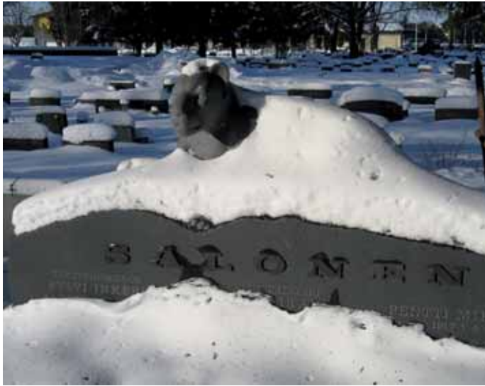
■ Pantteri nukkuu talviuntaan yli 20 asteen pakkasessa.

P orin ortodoksisen kirkon lähituntumassa levittäytyy Käppärän hautausmaa, jossa on maankuulu nähtävyys, Juseliuksen mausoleumi. Monet ortodoksisen kirkkoon tutustuvat löytävät hautausmaalta myös muita kiintoisia kohteita, kuten esimerkiksi pantterin ja kosketta- van muistomerkin talvisodan ajoilta.