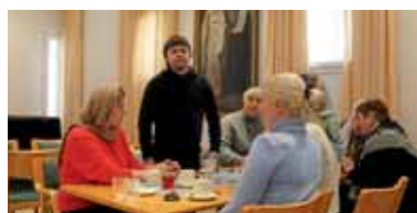
■ Pietarhovilainen ryhmä pistäytyi seurakunnassa vieraana matkallaan Italian Bariin pyhän Nikolaoksen reliikkiä äärelle.