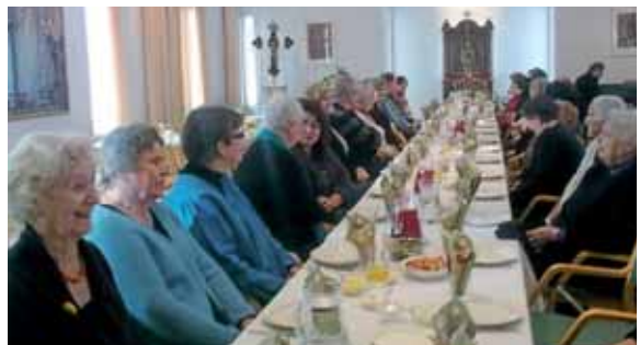
■ Imatran ja Lappeenrannan päiväpiirit kokoontuivat yhteiseen blinipäivään Imatran seurakuntatalolle.