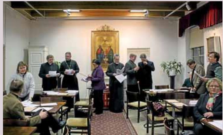
■ Savitaipaleen seurakunnan ryhmä vieraili Lappeenrannan kirkossa.