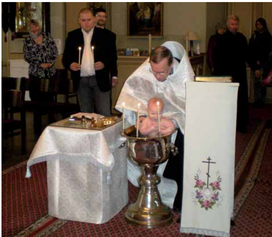
■ Pyhässä kasteessa lapsi liitetään Kristuksen yhteyteen.