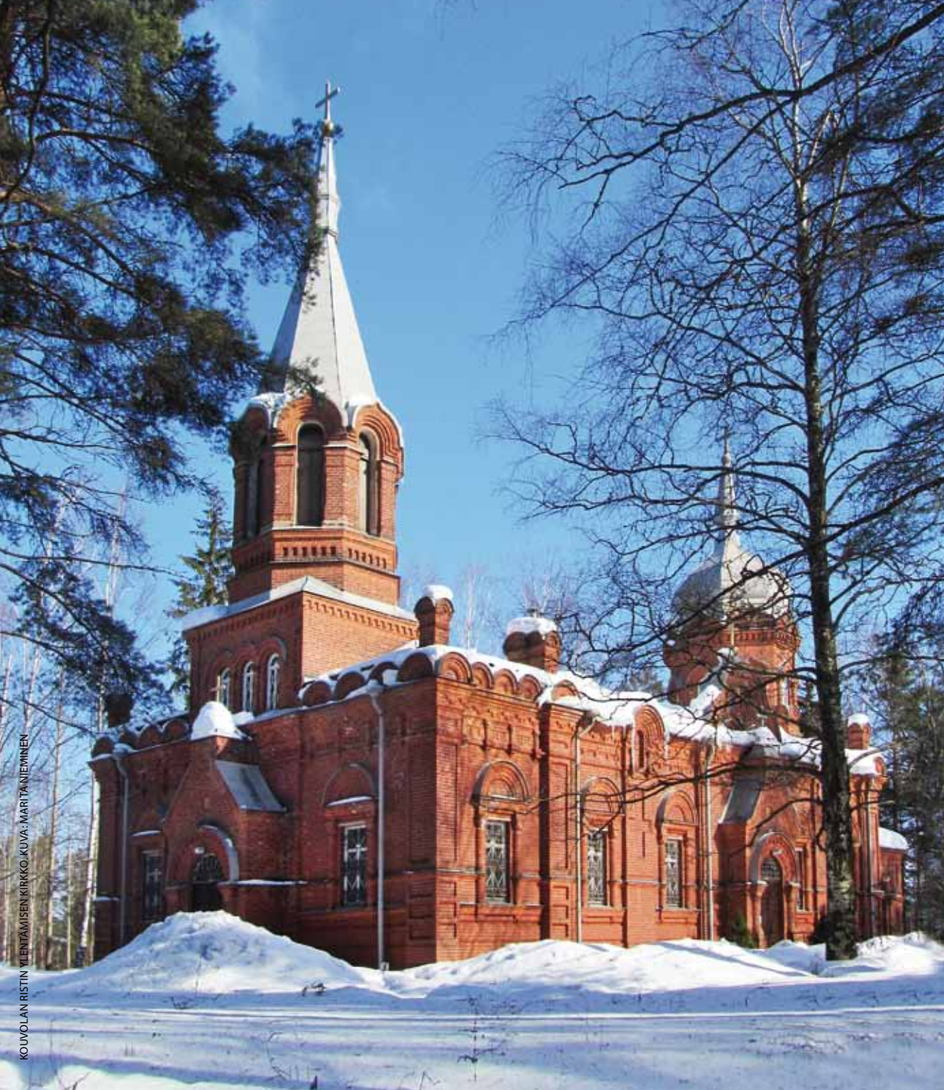
KOUVOLAN RISTIN YLENTÄMISEN KIRKKO.

HAMINA 2–4, HÄMEENLINNA 5–7, KOTKA 7–9, LAHTI 9–13, LAPPEENRANTA 13–18, TAMPERE 19–21, TURKU 22–24