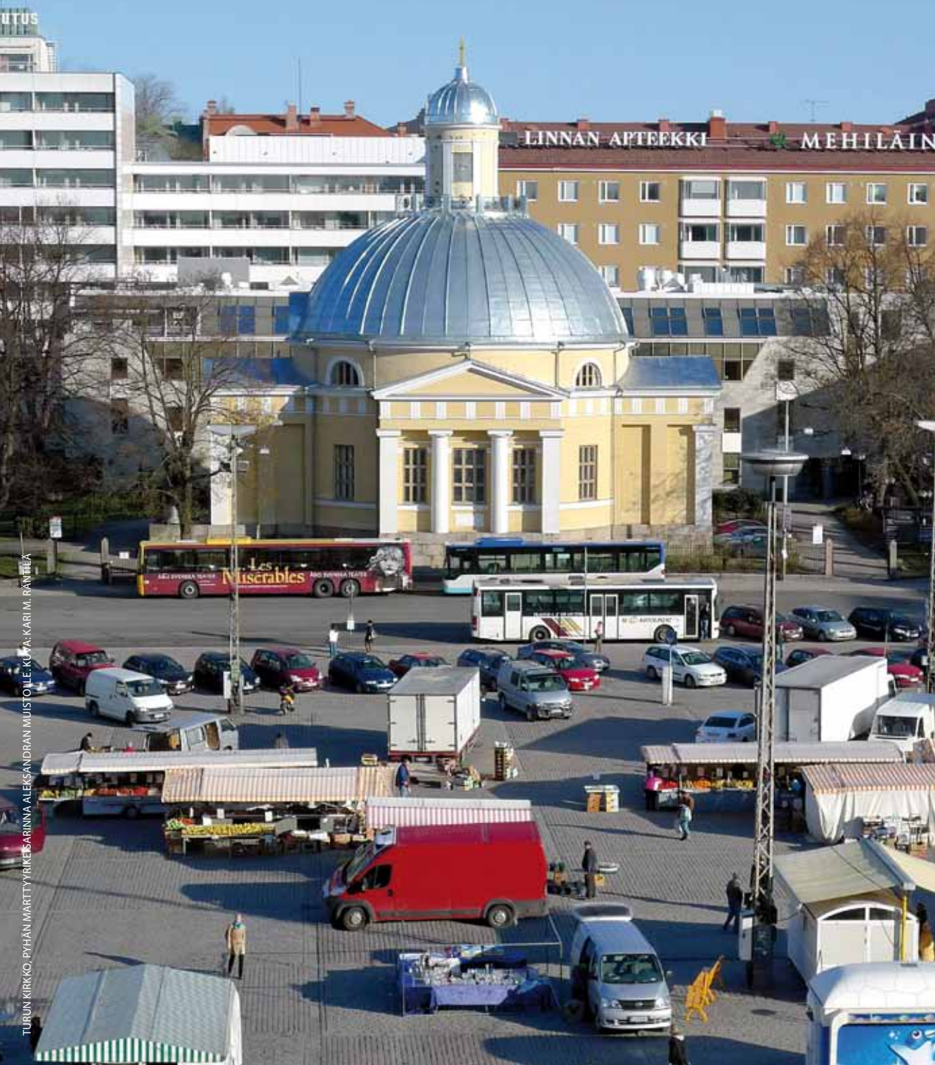
TURUN KIRKKO, PYHÄN MÄRTTYRYKESARINNA ALEKSANDRAN MUISTOLLE. KUVA: KARI M. RÄVITÄ

HAMINA 2–5, HÄMEENLINNA 6–8, KOTKA 9–10, LAHTI 11–13, LAPPEENRANTA 14–17, TAMPERE 18–21, TURKU 21–23