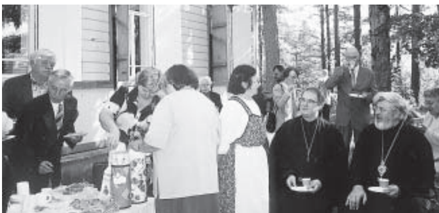
Ahveniston praasniekkajuhla elokuussa 2000.