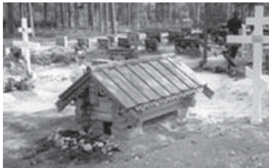
Haudanpäällisrakennus eli grobu Nurmeksen ortodoksisella hautausmaalla.

Pukemisen jälkeen vainaja asetetaan arkkuun. Otsalle asetetaan otsanauha , jossa on teksti: ”Pyhä Jumala, Pyhä Väkevä, Pyhä Kuolematon, armahda mei-