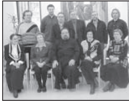
TAMPEREEN SEURAKUNNAN VALTUUSTO 2002-2004: