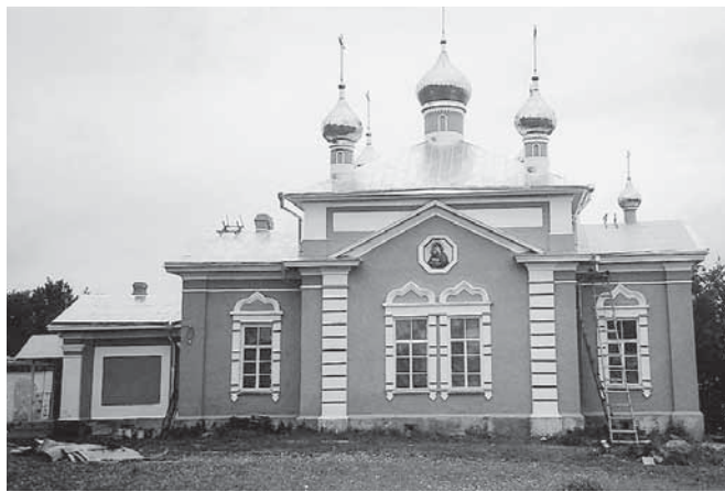
Vasojärven luostarin kaikkien pyhien kirkko on nyt saanut uudet kupolit tuhoutujen tilalle.

hannes Kronstailaiselle pyhitetty porttikirkko palautettiin entiseen käyttöön. Veljestön tuhotun hautausmaan paikalle pystytettiin Venäjän kaikkien uusmarttyreiden muistolle pyhitetty tsasouna. Helmikuun 22. päivänä 2001, pyhien Gennadin ja Nikiforin muistopäivänä, toimitettiin Petroskoin ja Karjalan arkkipiispan johdolla juhlatilurgia, ja luostari sai takaisin aikaiseman miesluostarin asemansa.