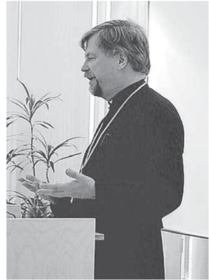
KP metropoliitta Ambrosius piti ensimmäisen alustuksensa virkaan astumisensa jälkeisen kirkon hallinnon ja talouden seminaarissa Tampereella 4. toukokuuta.

- Tähän liittyy keskeisesti kysymys siitä, että meidän tulisi kasvattaa omia