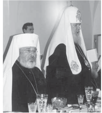
KP arkkipiispa Leo Hänen Pyhyytensä patriarkka Aleksi II:n tarjoamilla illallisilla Moskovassa.

Kaikkiin esittämiini keskusteluteemoihin sain myönteiset vastaukset. Venäjän kirkon johto ilmoitti kunnioittavansa Suomen ortodoksisen autonomisen kirkon kanonista aluetta. Se ei perusta vallitsevissa oloissa alueellemme hiippakuntaa eikä seurakuntia. Suomen ortodoksisessa kirkossa me pyrimme palvele-