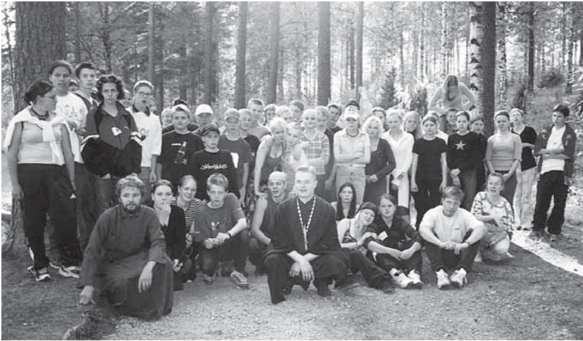
Tampereen, Turun ja Hämeenlinnan kristinoppileiriläisiä Julkujärven leirillä kesällä 2002.

Tampereen, Turun ja Hämeenlinnan seurakuntien yhteinen kristinoppileiri järjestettiin Julkujärven leirikeskuksessa Ylöjärvellä 6.-14.7. Alkujännityksen hahduttua olivat kriparilaiset sitä mieltä, että leirillä olisi voinut vietää vielä toisenkin viikon.