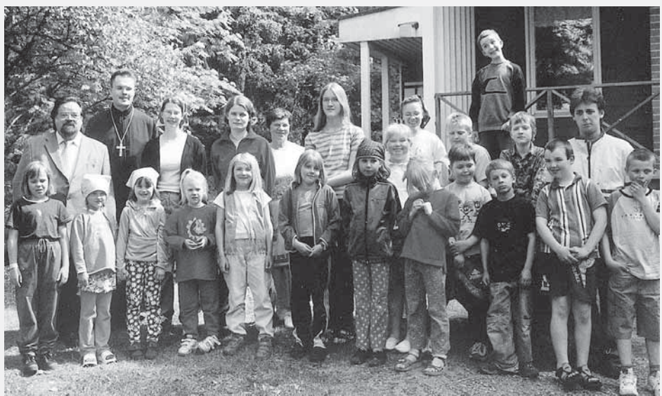
Tampereen ja Hämeenlinnan lastenleiri kesäkuussa 2002. Lisää leiriasiaa sivuilla 22-23.

Suomalaisina kristittyinä sanoudumme kaikissa olosuhteissa irti väkivallasta. Puolustamme samalla tavoin kummannin, sekä israelilaisten että palestiinalaisten, oikeutta omaehtoiseen elämään ja myös omaan valtioon.