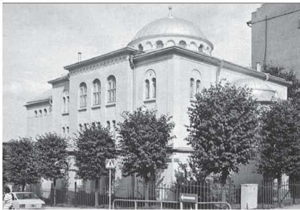
Turun bysanttilaistyylinen synagoga.