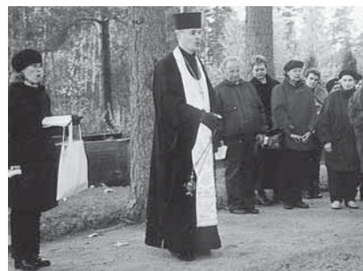
Dimitrin lauantai Hämeenlinnan ortodoksisella hautausmaalla v. 2001.

venäläiseen perinteeseen. Suuriruhtinas Dimitri Donskoin aloitteesta säädettiin toimitettavaksi Kulikovon taistelussa v. 1380 kaatuneitten sotilaiden puolesta muistopalvelukset. Suuriruhtinaan kuoltua alettiin muistella myös häntä ja myöhemmin kaikkia uskossa nukkuneita. Dimitrin lauantaita ja radonitsaa vietetään erityisen hartaasti slaavilaisen perinteen alueella.