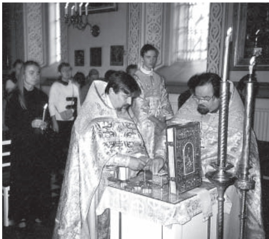
Mirhavoiteluun valmistautuminen liturgiassa pienen saaton yhteydessä. Tämän jälkeen kirkkoon liittyä voidellaan mirhalla (ks. kansikuva).

taan kunkin liittyjän kohdalla tapauskohtaisesti.