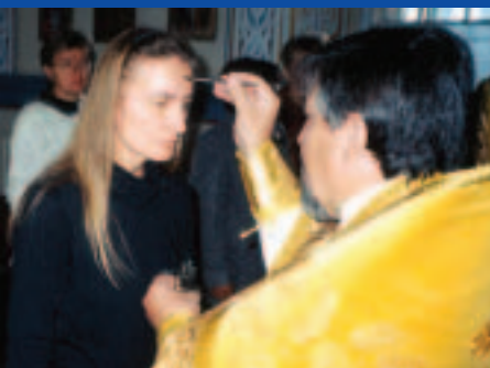
Kirkkoon liittyvä voidellaan mirhaöljyllä