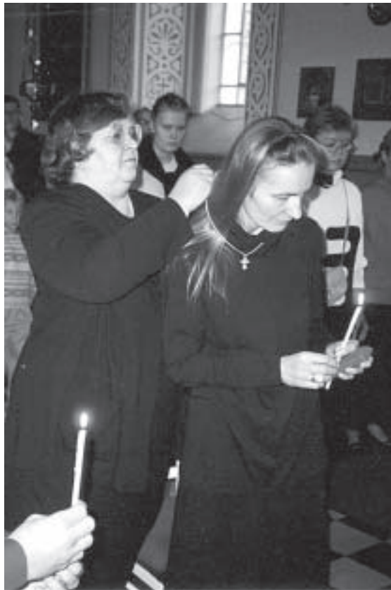
Jokaisella kirkkoon liittyvällä tulee olla kummi, joka ohjaa häntä kirkollisissa tavoissa. Kuvassa kummi asettaa pyhitetyn ristin mirhalla voidellun kaulaan.

Entinen ortodoksi voi palata kirkkonsa yhteyteen katumuksen sakramentin kautta. Ennen liittymistä tulee erota luterilaisuudesta sekä ottaa yhteyttä ortodoksisen seurakunnan pappiin. Liittymisilmoituksen täyttämisen jälkeen kirkkoonsa palannut osallistuu katumuksen sakramenttiin