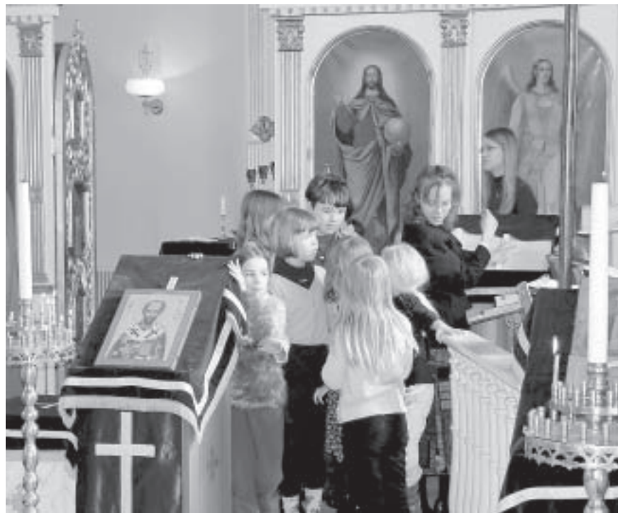
Laululeiriläiset kanttorinsa ympärillä.

Seurakuntamme alueella on myös paljon venäläistä väestöä, jotka eivät ole vielä löytäneet kirkkoaan. Moni heistä on siirtynyt luterilaiseen kirkkoon tai eri herätysliikkeiden piiriin, mutta suurin osa heistä ei kuulu mihinkään yhteisöön. Yksi ongelma heidän kohdallaan on