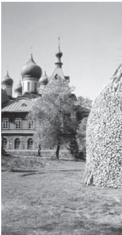
Pyhtitsan luostari Kuremäessä Itä-Virossa. Luostarissa on tällä hetkellä 160 nunnaa.