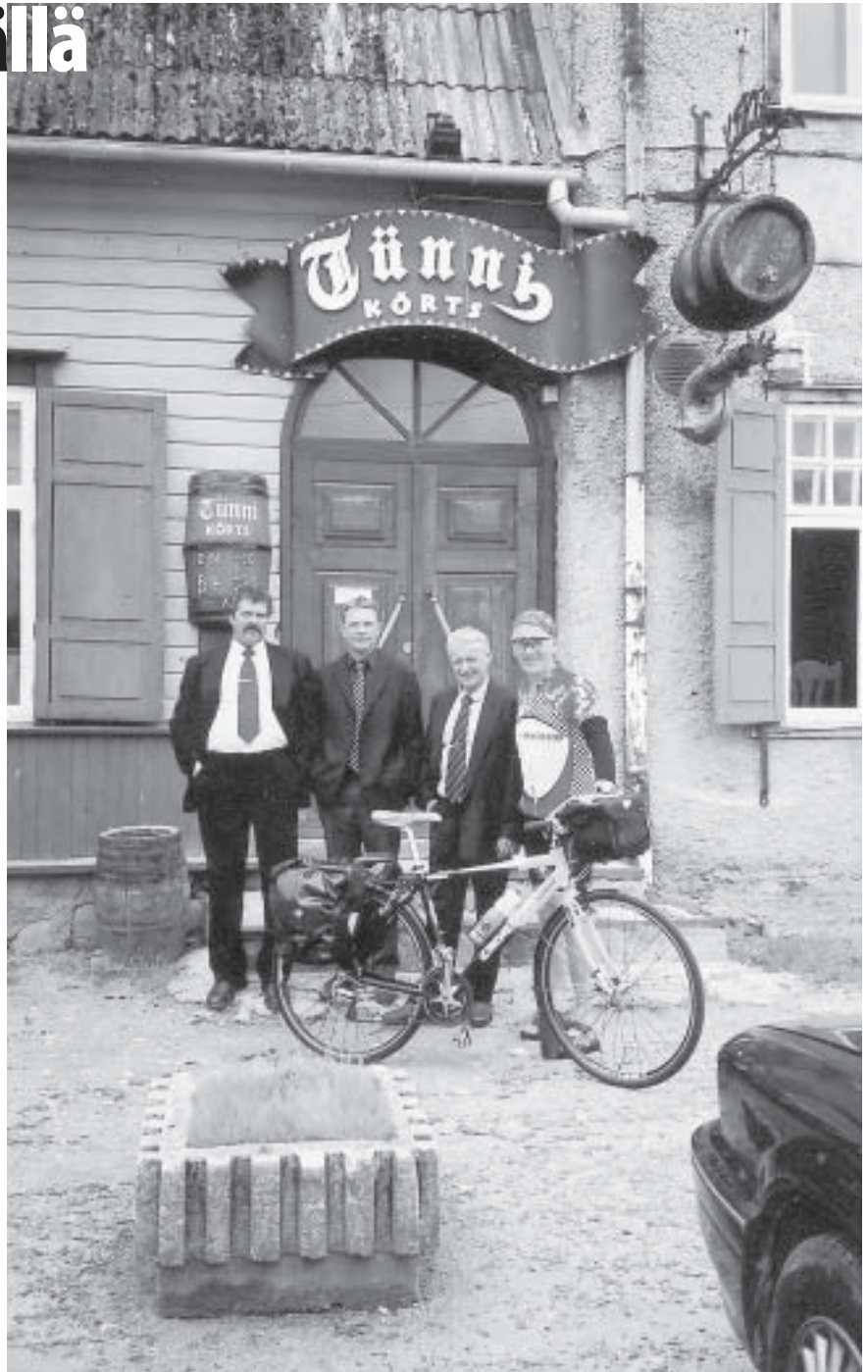
Vörtsjärven takana 137 km pyöräilyn lomassa piti aterioita seudun ainoassa kievarissa. Suljettu hautajaisten takia. Miehet mustissa pahoittelivat mutta pysyivät liittymään joukkoon. Tumma pukuni unohtui Turkuun.