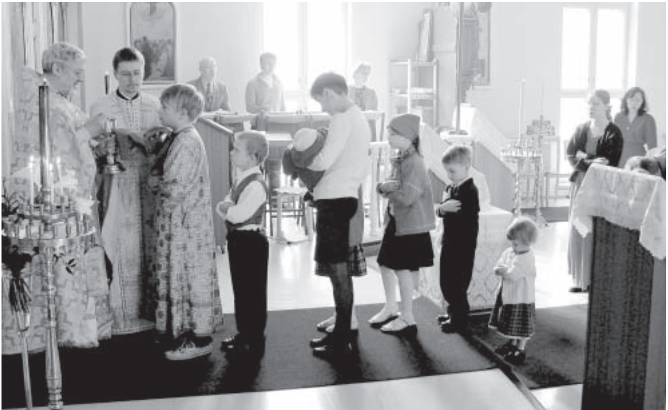
Lapset pääsiäisenä ehtoollisjonossa Hämeenlinnassa.

1/2002) päädyin maallistumisen ongelmaan. Uskonnolliset kysymykset ja kirkollinen elämä ei kiinnosta nykyajan ihmistä. Ongelmissa käännytään nykyään mieluummin psykiatrin kuin papin puoleen. Kumpikin ammattiryhmä edustaa myös hen-