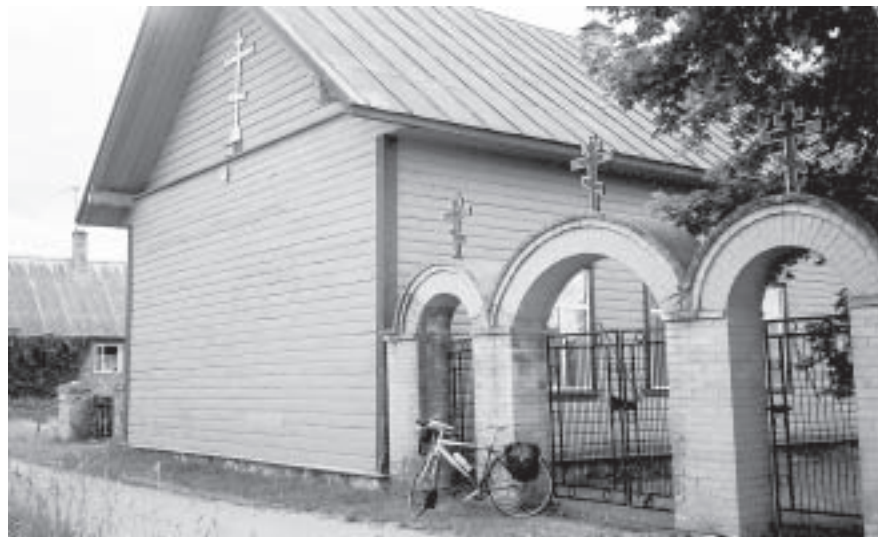
Kolkjan kylän vanhauskoisten kirkko sekä yksinäisen vaeltajan uskollinen ratsu.

Altskivessä kerrottiin, että Peipsi- ja Pihkovanjärven yhtymäkohdassa on Piirissaari, jossa asuu noin sata vanhauskoista ortodoksia. Kirkkojakin on kaksi. Sinne pääsee kantosiipi-