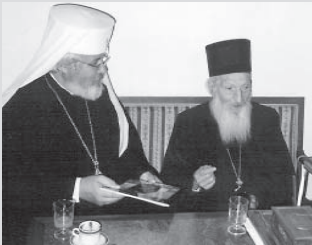
Arkkipiispa Leo korosti patriarkka Pavlille (s. 1914), että Suomen ortodoksit tukevat Serbian demokraatiakehitystä ja Serbian ortodoksisen kirkon näkyvää roolia koko Euroopan henkisessä kehityksessä.