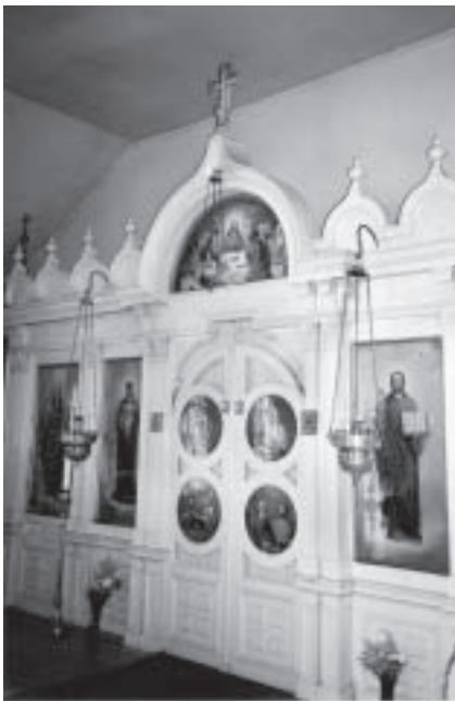
Viljandin siro kirkko sisältä.