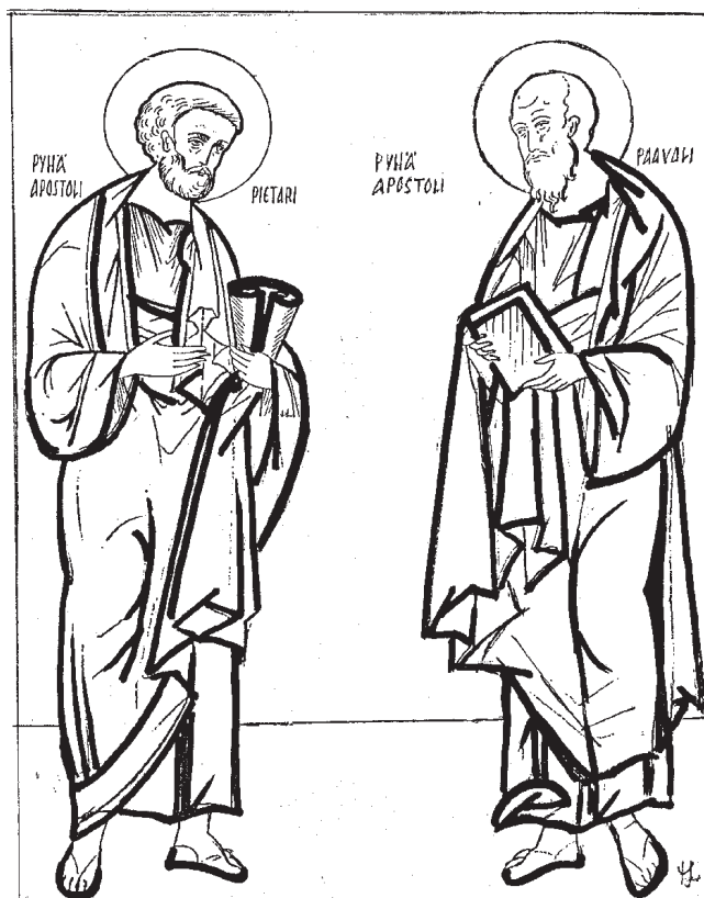
Piirros Margit Lintu

Apostoli Pietari teki lähetystyötä monissa paikoissa: Syyriassa, Pontuksessa, Galatiassa, Bityniassa, Vähä-Aasiassa ja Egyptissä. Lopulta hän päätyi valtakunnan pääkaupunkiin Roomaan. Perimätiedon mukaan hän toimi sen seurakunnan