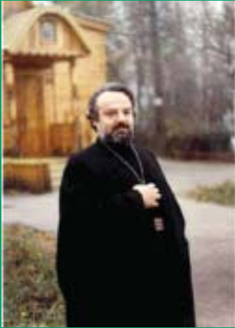
Isä Alexander Men