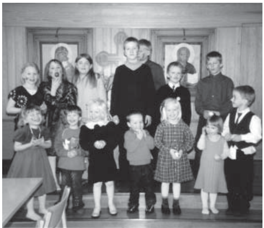
Lastenpääsiäisen pikku juhlijoita Hämeenlinnassa. Huomaa hienot kasvomaalaukset!