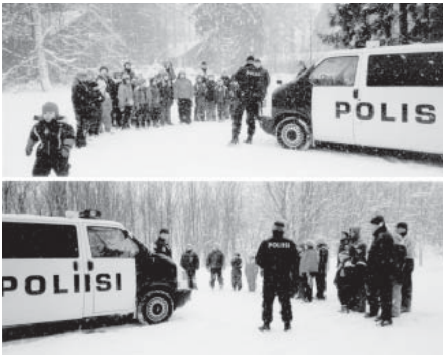
Poliisit kertoivat työstään leiriläisille ja jakoivat heijastimia ja pinssejä.

LEIRI PIDETTIIN 31.1.-1.2.2004 jo toisen kerran Hämeenlinnan ev.lut. seurakunnan leirikeskuksesta Loimalahdessa. Leiriläisiä oli kaikkiaan