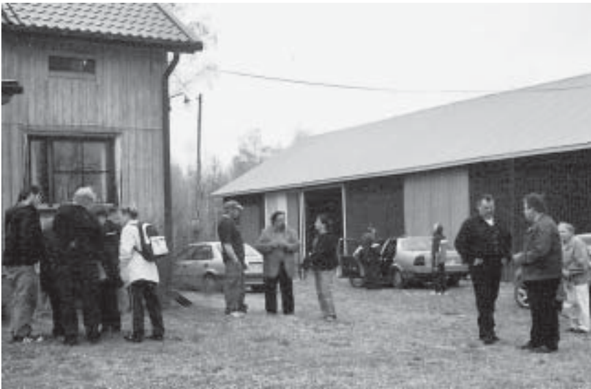
Porin tiistiseurain matkalaisia Lavian talolla.