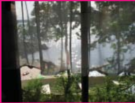
Auringonkiloa saunan ikkunasta