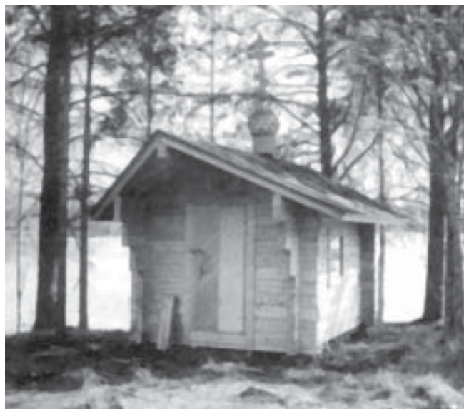
Pyhittäjämarttyyri Paraskevan tsasouna