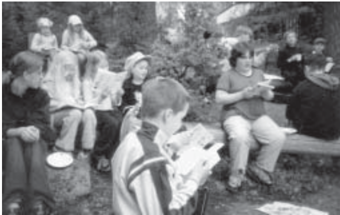
Hämeenlinnan ja Tampereen yhteinen lastenleiri pidettiin Hervannassa touko-kesäkuun vaihteessa. Kuva nuotiolla, jossa laulu raikui.