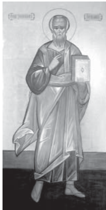
Porin kirkossa oleva Johannes Teologin ikoni.

Kristuksen ristin juurella apostoli Johannes sai erityisen tehtävän: hänen tuli huolehtia Jeesuksen äidistä, Neitsyt Mariasta. Tämä seik-