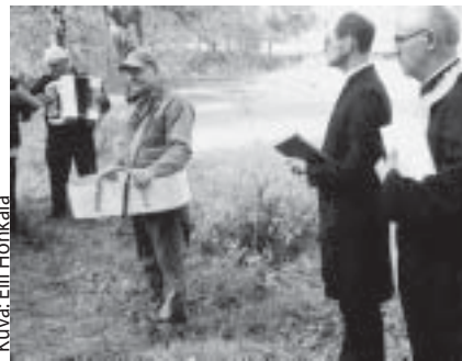
Touon siunaus Porin Ahlaisissa