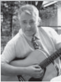
Kirjoittaja on tamperelainen musiikkituottaja