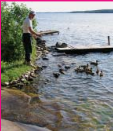
Sorsat tekevät tuttavuutta, rannan horisontissa Venäjä