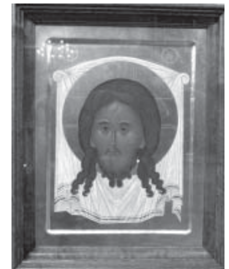
Käsittätehty Kristus – ikoni