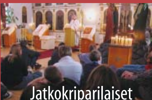
Jatkokriparilaiset kokoontuivat, s. 23