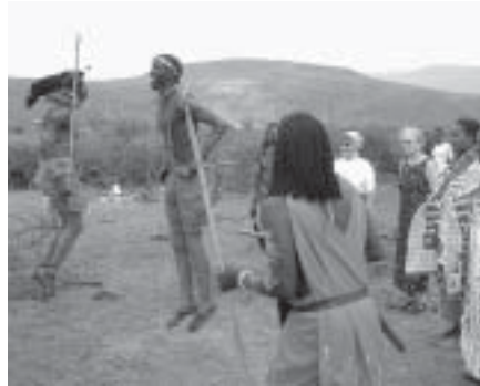
Kannen kuva: Suomalaisryhmä katselee ihastellen heille esitettyä maasaiden tervetuliaistanssia.

Saimme tutustua myös Nairobissa toimivaan ortodoksisen pappisseminariin. Seminaari kouluttaa koko Afrikan mantereeseen ortodoksisista väestöstä varten paimenia. Keniassa ortodoksi-pappeja on runsas 150. Pappien vaimoille on myös opetusta ortodoksisuudesta, ja he taas puolestaan ovat