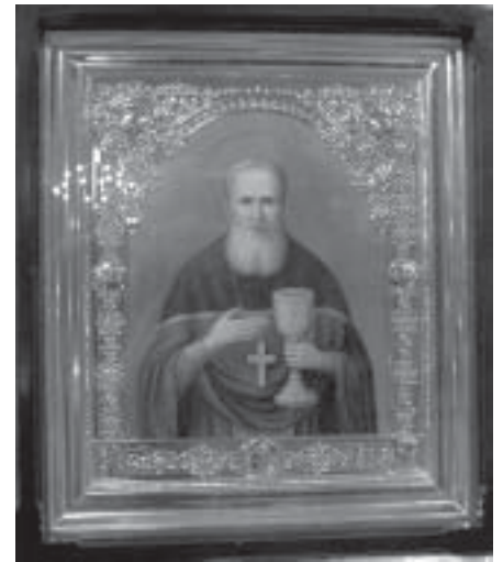
Pyhän Johannes Kronstadtilaisen (1829–1908) ikoni