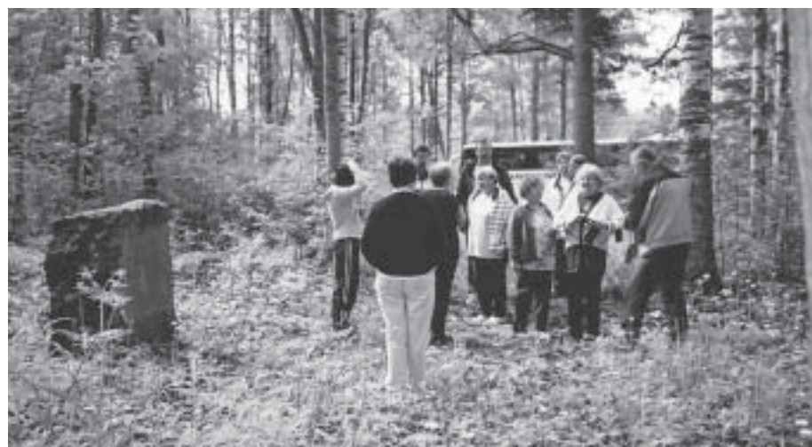
Vierailijoita Palkealan kirkon muistokivellä.