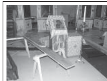
Hämeenlinnan kirkko sai uuden lattian.