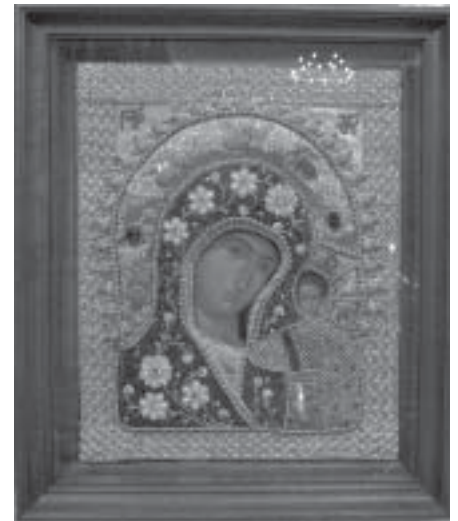
Kazanin Jumalanäidin ikoni