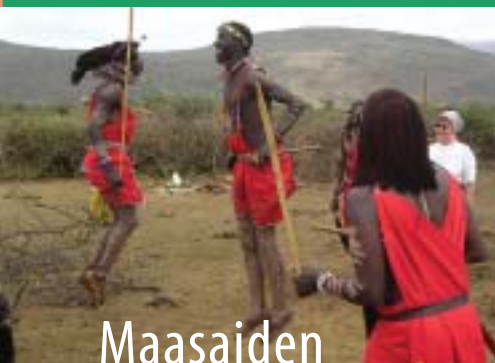
Maasaiden tervetuliaistanssi Keniassa, s. 6