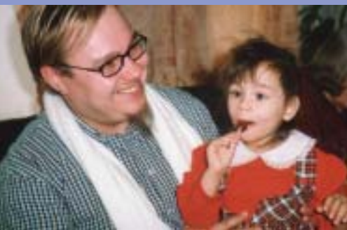
Pietarin lastenkodin "suklaasilmä", s. 23