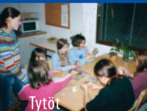
Tytöt askartelivat hevostaulun, s. 20