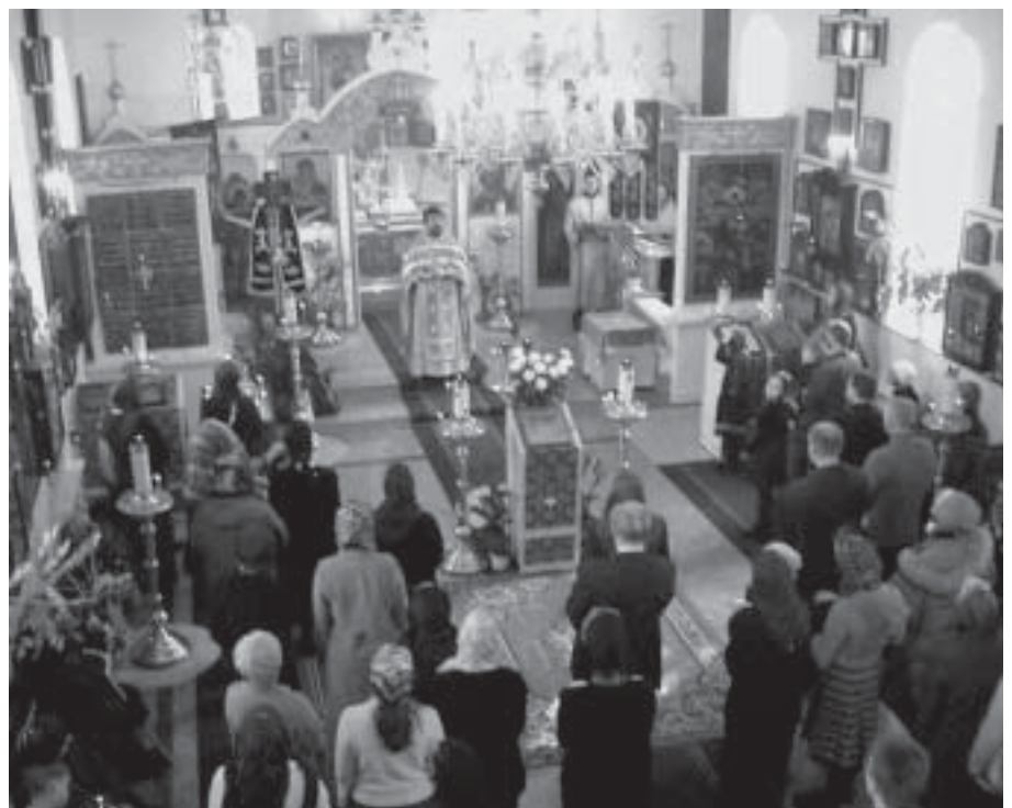
Jumalanpalvelus Helsingin venäläisessä Pyhän Nikolauksen kirkossa.

Toinen ongelma liittyy pääsiäiseen. On vaikea pakottaa ihmisiä juhlimaan pääsiäistä uuden ajanlaskun mukaan. Monet ovat tiiviissä yhteydessä kotimaansa venäläisten kirkkojen ja luostareiden rippii-isien kanssa. Sieltä he eivät saa diplomaattisia oh-