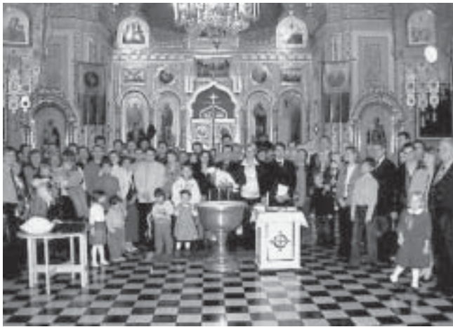
Romanialainen jumalanpalvelus kymmenen vuotta sitten Tampereen kirkossa.