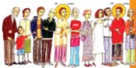
Serbian ortodoksisen kirkon aids-juliste. Pyhät Kosmas ja Damianos tukevat sairaita.

Aidsin leviäminen Euroopassa on nopeinta Balkanilla, Ukrainassa ja Venäjällä. Siksi myös ortodoksinen kirkko on lähtenyt eri puolilla Eurooppaa auttamaan aidsin uhreja. Suomen ortodoksisen kirkon paastokeräyksen kohteena on Serbian ortodoksisen kirkon aids-työ.