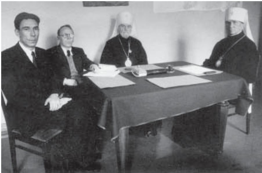
Venäjän patriarkka Aleksej edustajan Leningradin metropoliitta Grigorin käynti Kuopiossa 30.10.1945. Tarkoituksena oli saada Suomen ortodoksinen kirkko liittymään Moskovan patriarkaattiin.

Tämä on ymmärrettävää, sillä onhan tunnettua, että Laatokan Valamosta tulleet veljet eivät koskaan kotiutuneet uuteen Valamoon. He, niin kuin Venäjältä syntyisin ollut johtajansakin, tunsivat jatkuvasti ankaraa koti-ikävää ja nyt, sodan vihdoon tauottua, toivoivat, että mahdollisuudet kotiin pääsyyn avautuisivat Moskovan patriarkaattiin liittämisen kautta.