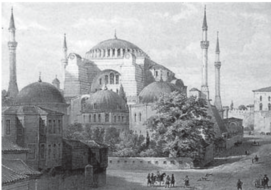
Litografia Hagia Sofiasta vuodelta 1852 (Fossati-veljekset, Athens Gennadeios Library).

Lintulan sisarilla on hieman vapaata raskaan kesäkauden jälkeen. Itse olin lokakuun lopussa sisar Leenan kanssa Istanbulissa lähinnä tutustumassa kirkkomme keskukseseen, Konstantinopolin patriarkaattiin ja kaupungin nähtävyyksiin. Asuimme Elävöittävän lähteen luostarissa kaupungissa. Luostari on rakennettu v. 450. Monta kertaa se on tuhottu. Kerran turkkilaiset hävittivät sen ja rakensivat paikalle hautausmaan. Nykyinen kirkko on rakennettu 1834. Vuonna 1955 muslimit sulkiivat luostarin ja pitivät aluetta kaatopaikkana.