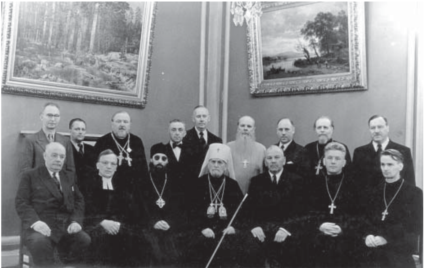
Venäjän ortodoksisen kirkon kutsuma suomalaisten valtuuskunta Leningradissa metropoliitta Grigorin ja muiden isäntien seurassa. Valtuuskuntaan kuului sekä ortodokseja että luterilaisia.

Moskovan patriarkaatilta eivät keinot näyttäneet loppuvan. Koska Suomen ortodoksit eivät olleet taivutettavissa, otettiin esille järeämpi ase. Moskova lupasi kesällä 1948 Suomen