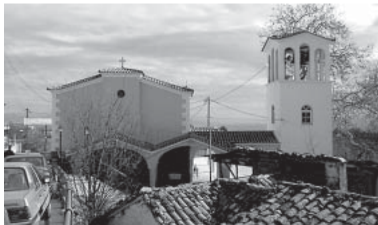
Kryonerin kirkko on päällepäin yksinkertainen, valkoinen ja suorakaiteen muotoinen, mutta sisältä kirkko on hyvin viehättävä

paljoa väkeä, joten löysin hyvän seisomapaikan parvelle vievien rappusten vierestä aivan penkkien takariviltä. Sieltä oli kaikessa hiljaisuudessa hyvä tarkkailla tilannetta. Kirkossa oli paljon ikoneita. Ikonostasissa ikonit olivat normaaleilla paikoillaan. Kehystettyjä ikoneja oli puolentusinaa eri puolella kirkkoa, mutta niiden lisäksi kirkon kaikkia seinäpintoja ja välikattoja peittivät ikonimaalaukset. Kuoro oli pienehkö, kaikki miehiä. Kaksi kuorolaista, psalttia , lauloi vasemmalta puolella, ja neljä oikealla. Heillä oli omat seisomaistuimensa. Useimmat veisut olivat ikään kuin vuoropuheluita. Ennen liturgiaa suo-