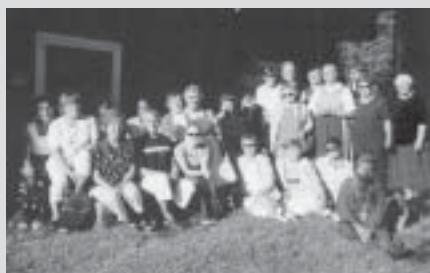
Pihakahvilatalkoolaiset ryhmäkuvassa (vuonna 2002).

Pitsiviikkoa on Raumalla vietetty 38 vuoden ajan. Tsasounan pihakahvila palveli tänä vuonna kymmenennen kerran. Se keksittiin järjestää kesällä 1996 rukoushuoneen 40-vuotisjuhlan tarjoiluun rahoittamiseksi. Silloin raumalaiset löysivät kaupungissaan ortodoksisen rukoushuoneen, kiinnostuivat siitä. Heistä on tullut uskollisia