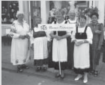
Rauman Pitsiviikon 2001 juhlakulkueeseen osallistuneet tiistaiseuralaiset.

Vuosittain heinäkuun viimeisellä viikolla vietetään Raumalla Pitsiviikkoa, kesäistä tapahtumaa, joka saa liikkeelle raumalaiset ja houkuttelee kaupunkiin runsaasti turisteja. Pyhän