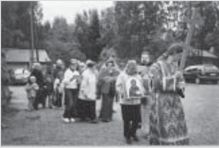
Leiriläiset ristisaatossa menossa meren rantaan vedenpyhitykseen.

ret pelasivat tämän ajan ulkona tai askartelivat kauniita töitä ruokalassa. Osa koekeli myös kalaonneaan meren rannalla.