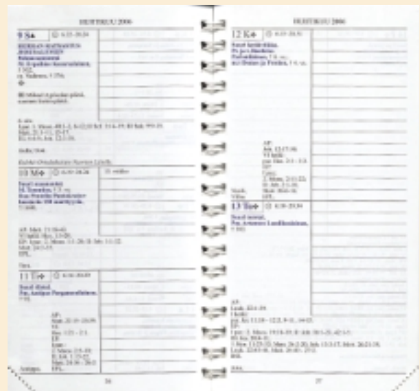
Ortodoksisen kalenterin sisäsivuilta.

Tässä olen nostanut esiin muutamia havaintoja ja kysymyksiä. Mikä olisi rat- kaisu? Kirkkokuntamme on pieni, ja kalenterien ko- konaistarve ei ole monia- kaan satoja. Olisiko siirryt- tävä kalenterin osalta in- ternetissä julkaistavaan versioon? Vaikka se ei olisi mitenkään mahdoton rat- kaisu, se ei olisi lopullinen