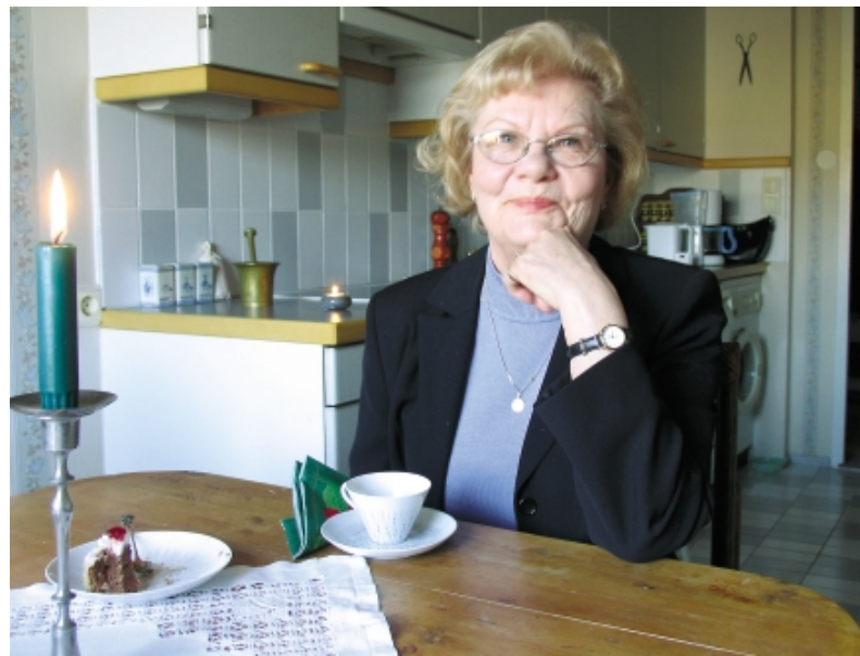
Leenan mielestä meidän tulee olla ystävällisiä toisillemme. Aikanaan hän itsekkin sai sitä kokea etsiessään tietään kirkon yhteyteen.

– Haluan myös ajatella näin, että kun kirkkoon tulee maahanmuuttajia, niin