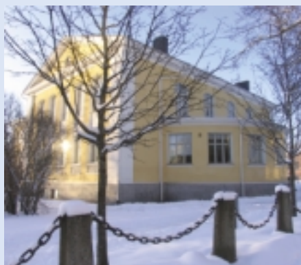
Vanha ortodoksinen kirkko, nykyinen aikuiskoulutuskeskus, idästä päin katsottuna. Pyöreässä alttarissa on nykyään kaksi seminaarihuonetta.

”Ajatus on kristillisen uskon ja tradition kannalta perusteltu. Myös luterilaisen kirkon kirkkojärjestys lähtee siitä, että ”kun kirkko on vihitty, sitä saa käyttää vain sen pyhyyteen soveltuviin tarkoituksiin”. Sana ”kirkko” tulee kreikan kielen sanasta kyriake, joka tarkoittaa ”Herralta kuuluvaa”.”