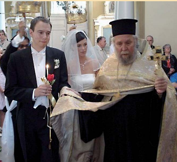
■ Jesajan tanssi