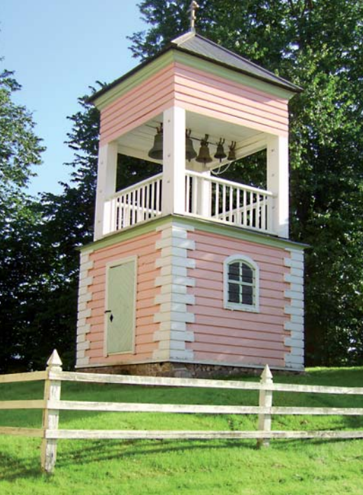
■ Loviisan kirkon kellotorni.

hopeinen riisa, johon myös on pakotettu kirkkovuoden kaksitoista juhlaa. Joidenkin tietojen mukaan näitä ikoneja olisi tehty kaksi, mutta ei tiedetä, missä toinen nyt on.