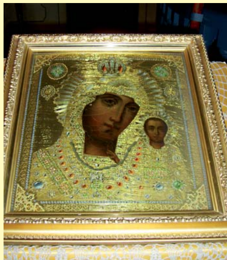
■ Jumalansynnyttäjän kasanilainen ikoni.