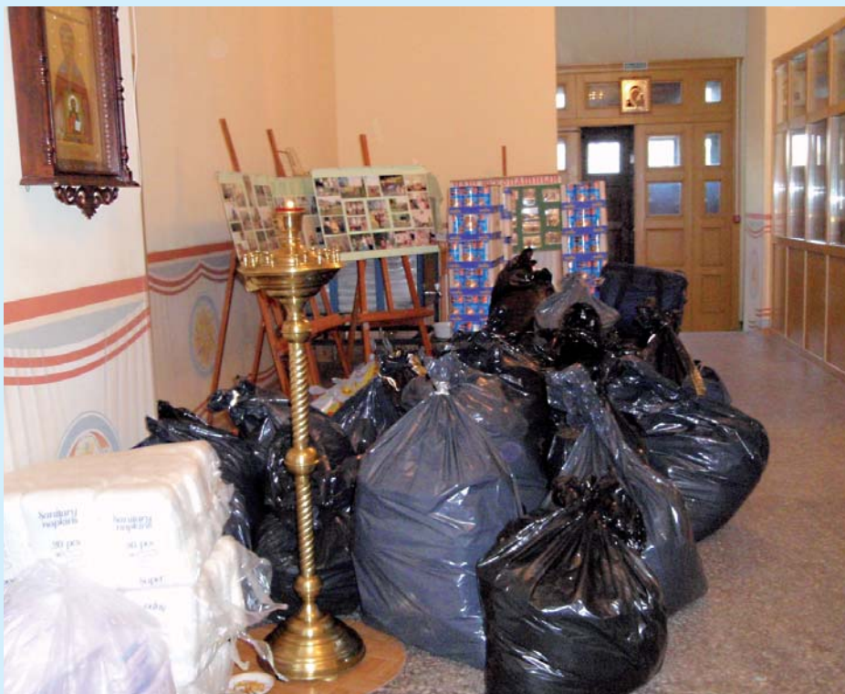
■ Avustuskuorma on saatu perille Pyhän Andreas Kreetalaisen seurakuntaan.

Kaupungissa kerrotaan olleen 400 kirkkoa, joista noin kymmenesosa on nyt käytössä. Itseäni hiukan hämmensi se, että oppaan mukaan kirkot olivat muinaisina vuosisatoina olleet jonkinlai-