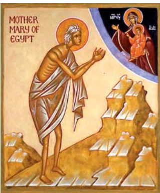
Pyhittäjä Maria Egyptiläinen 29.3.