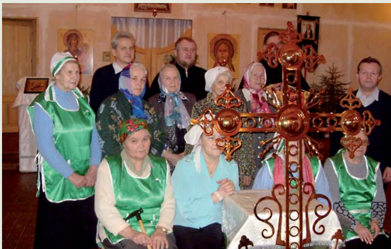
■ Seurakuntaväkeä juuri siunatun kattoristin ympärillä.

Valamon ja Lintulan luostarit ovat yhä kiinnostavampi kohde muun muassa pietarilaisille ortodoksisille pyhiinvaeltajaryhmille, joista suurin osa kulkee seurakuntamme kautta kohti luostarejamme.