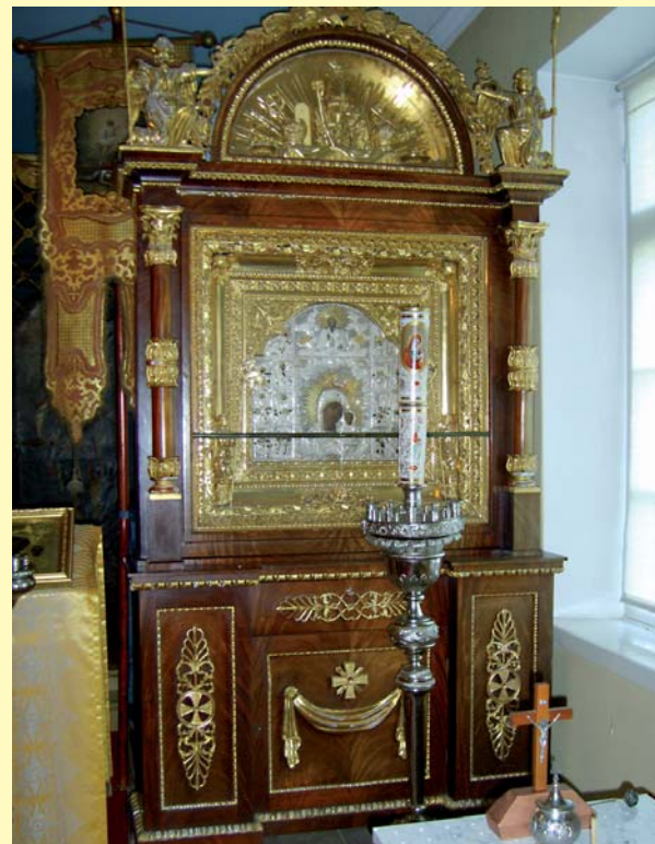
■ Jumalansynnyttäjän kasanilaisen ikonin kiota.