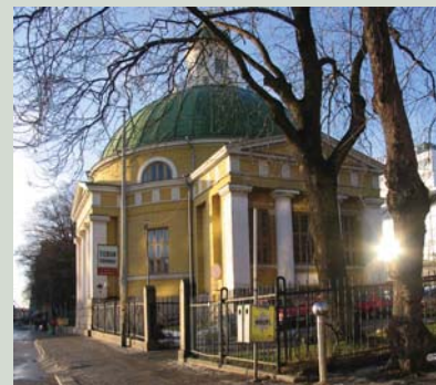
Turun kirkko, pyhän marttyyrikeisarinna Aleksandran muistolle