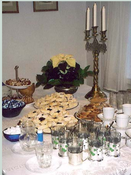
■ Praasniekan herkkupöytä.