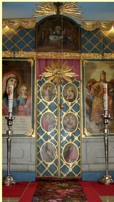
■ Loviisan kirkon ikonostaasin pyhä portti.

Seuraavaksi kirkko siirtyi Käkisalmeen. Siellä vuonna 1804 rykmenttiin kuului lähes tuhat miestä. Kun Suomi