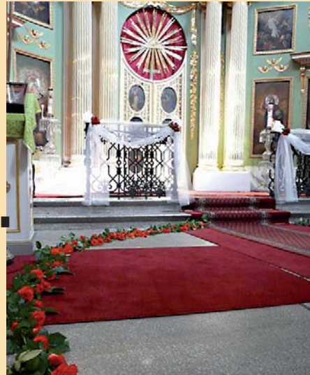
■ Kirkon koristelua

leet ovat ajan saatossa muuttuneet kruunuiksi. Morsiusparin ystävät toimivat kruununkantajina. Toimituksessa rukoillaan vihittäville keskinäistä rakkautta, toinen toisensa tukemista, kunnioittamista ja osallisuutta ikuisen elämään. Kruunut kuvaavat tulevassa elämässä saatavaa voittoa tästä maallisesta elämästä.