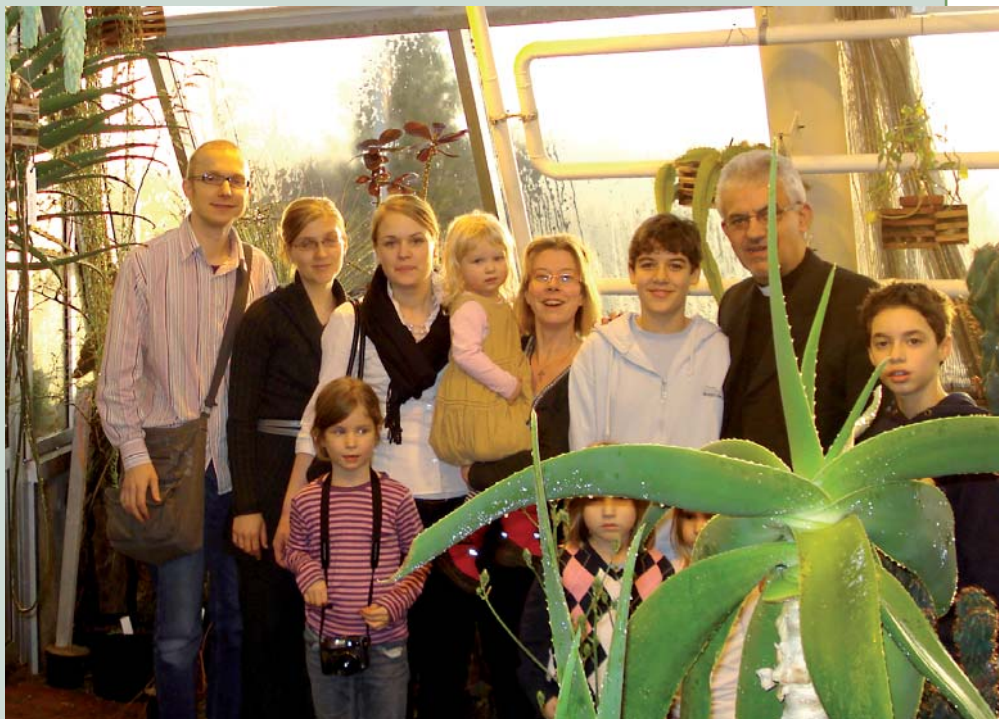
■ Joulukiireiden keskellä lastenkerho teki retken Ruisalon kasvitieteelliseen puutarhaan.

Joulupukkia ei tarvinnutkaan Ruisalon retken jälkeen enää kauaa odotella. Jouluaattona kirkossa jaettiin paikalla olleille lapsille runsaat jouluherkkupussit. Seurakunnan joulujuhlassa, jota tänä vuonna vietettiin aiemmista vuosista poiketen vasta juhla-ajan alettua 28.12., oli tiedossa vielä lisää herkkuja ja yllätyspusseja. Seurakunnan joulujuhlassa esiintyi myös tänä syksynä toimintansa aloittanut lapsikuoro. Kuorolaiset toivovat joukkonsa kasvavan ensi vuodeksi, joten tule sinäkin mukaan! Lapsikuoro on tarkoitettu esikouluikäisille ja sitä vanhemmille lapsille, ja se kokoontuu seurakuntasa-