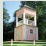
Loviisan kirkon kellotorni

Ke 7.7. klo 17 ehtoopalvelus ja litania hautausmaan avokappelissa To 8.7. klo 9.30 vedenpyhitys ja liturgia, praasniekkakahvit