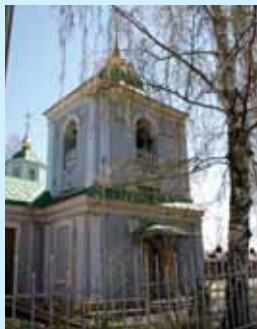
Lappeenrannan Pokrovan kirkko