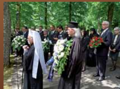
Saattoväki laskemassa muistoseppeleensä, edessä (vas.)Viron kirkon metropoliitta Stefanos.