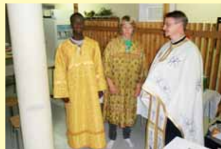
■ Leiriläiset toimivat jumalanpalveluksissa alttariapulaisina.