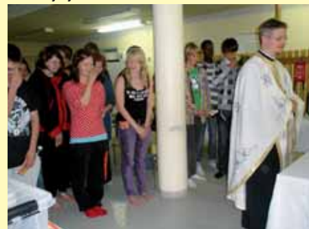
■ Leirillä toimitettiin päivittäin jumalanpalveluksia.