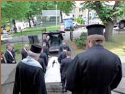
Hautauspalveluksen jälkeen alkoi matka hautausmaalle.

Ks. kuvia hänen hautajaisistaan sivuilta 9-11.