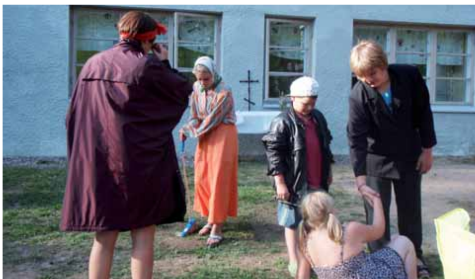
■ Leirin päätteeksi lapset esittivät vanhemmille valmistamansa näytelmät.