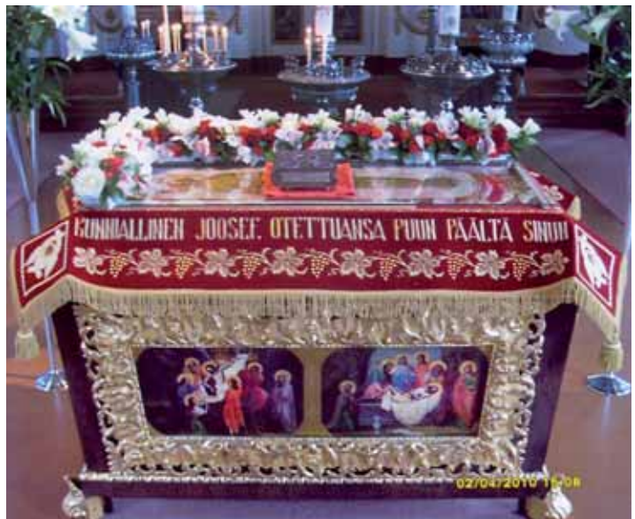
■ Pühtitsan hautapeite Turun kirkossa pääsiäisenä 2010.