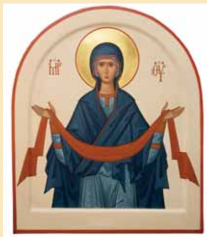
■ Ikonimaalaus vaatii aikaa ja hil-jentymistä. Kurssin loputtua mesta-rinkin työstä jäivät vielä kultakoristelut puuttumaan.