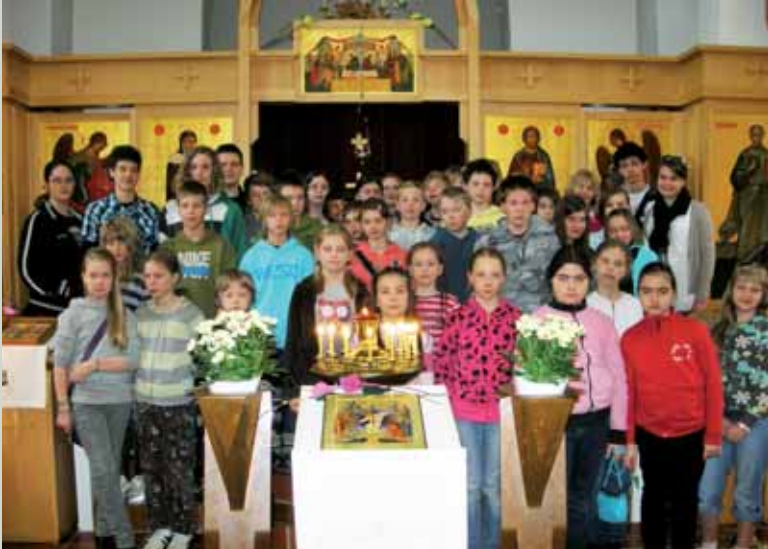
■ Turun koululaisten ryhmä opettajineen Porin kirkossa.