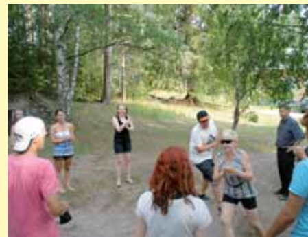
■ Ohjaajat kertasivat leikkejä ennen leirin alkua.

pidettiin 29.7.-6.8. Saloiston leirikeskuksessa Janakkalassa