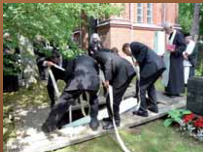
Hautaan laskeminen Turun ortodoksisella hautausmaalla.