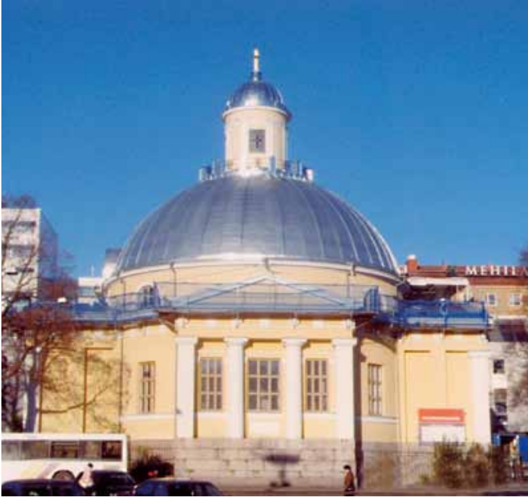
● Turun kirkon katto kiiltelee uutuuttaan, kun Turku on vuonna 2011 Euroopan kulttuuripääkaupunki.