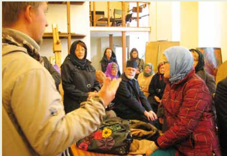
● Aleksanteri Nevskin lavran ikonimaalauksosasto.

me tuohuksia ja saimme siunauksen pyhitetyllä öljyllä rukouspalvelusta toimitavalta papilta. Jätimme myös esirukouspyyntöjä Ksenialle kirjeiden muodossa. Seuraavaksi suuntasimme pyhittäjä Johannes Rilalaisen luostariin Karpovkajoen varrelle, jossa sijaitsee pyhän Johannes Kronstadtilaisen hauta. Kunnioitettuamme hänen pyhäänjäänöksiansä matkamme jatkui ”Pyhä Venäjä”