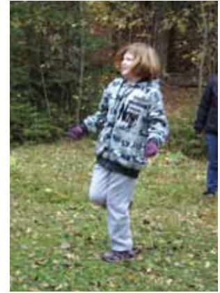
● "Vettä kengässä".