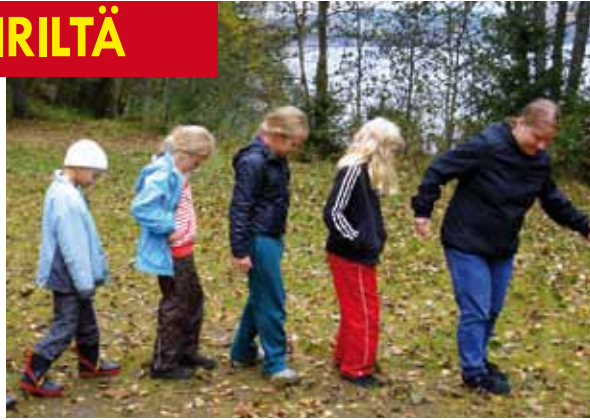
● Polttopallokentän merkitseminen.