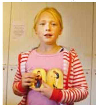
● Leiriltä mukaan oma ikoni.