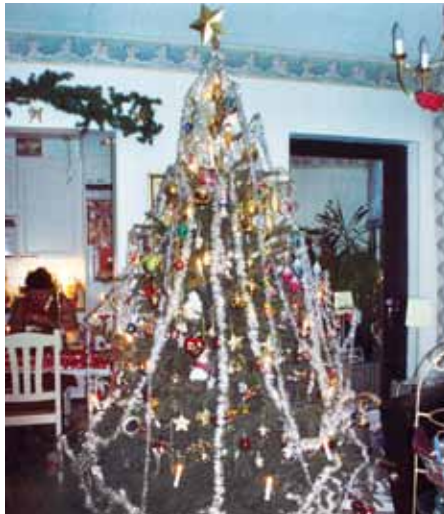
● Kanttorilan joulukuusi.

kristillisen sanoman julistajan. Tähti pitää muistaa laittaa ennen kuin kuusen nostaa pystyyn. Niin sen saa helpoiten paikoilleen. Tähti johdatti tietäjät itäisiltä mailta kumartamaan vastasyntyntä Kuningasta. Eräs satu kuusesta kertoo, miten luontokappaleetkin tulivat seimen ääreen Jeesus-lasta tervehtimään. Sypressi ja oliivipuu toivat kukkia ja lahjojaan vastasyntyneelle. Kuusi seiso tyhjin oksin vieressä. Lapsukaisen kävi kuusta sääliksi, ja hän pyysi enkeleitä koristelemaan kuusen kauneimmaksi puuksi.