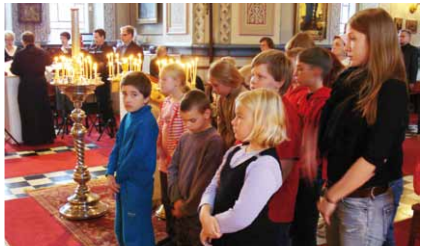
● Tampereen kirkossa liturgiassa.