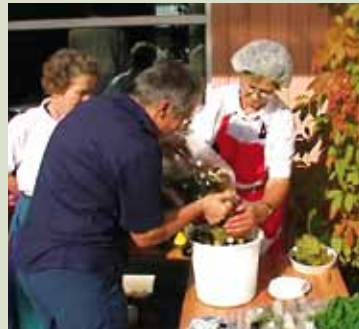
● Myyjäiset yhteisössä.