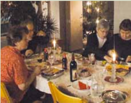
● Joulun vietto yhteisössä.