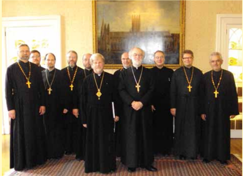
● Hiippakunnan kirkkoherrat metropoliitan johdolla arkkipiispa Rowan Williamsin (ed. oik.) vastaanotolla.