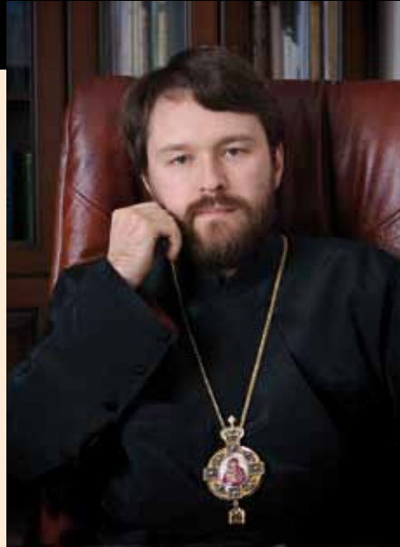
● Metropoliitta Hilarion

Ensimmäiset vuodet kirkon ja valtioiden suhteiden kehittämisessä olivat hyvin vaikeita. Jotkut virkamiehet, jotka kääntyivät nopeasti kommunisteista ”demokraateiksi”, yrittivät haitata Venäjän kirkon työtä suosimalla uuden alun saaneita muita uskonnollisia yhteisöjä. Koko