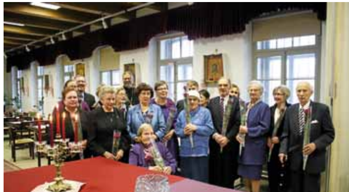
● Jumalansyntyttäjän temppeliin tuomisen juhla vietettiin seurakunnan länsialueen syntymäpäiväsankareiden yhteistä juhlaa.