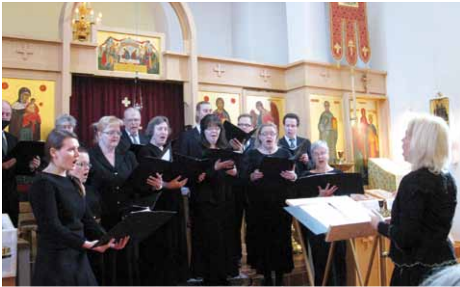
● Tampereen kuorossa on mukana viitisentoista aktiivia.