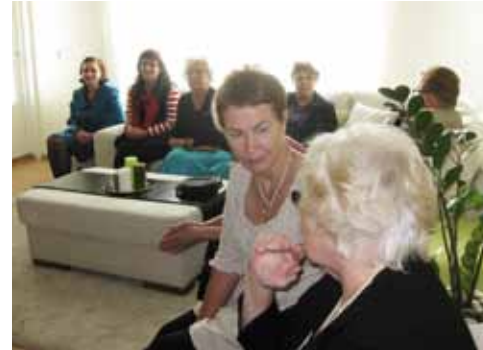
● Muistoja Turun Tiistai-seuran syksyn aloitusillasta Duraceilla.