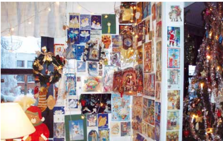
● Kanttorilan joulunainen korttiseinä.

Adventtikalenterit saavat lapset valpastu-maan. Joulukalentereita on hankittu kaikille tasapuolisesti. Erikoisista kalentereista tehdään jopa luukun avausvuorot. Kuudennen luukun takana on aina joulupukki. Onhan 6.12. pyhän Nikolaoksen juhlapäivä, silloin Nikolaos on käynyt yön aikana tuomassa sän-gyn alle kenkään pienen lahjan. Kuusta koris-teltaessa lelutkin tekevät joulurauhan. Rak-kaimmat pehmolelut tuodaan joulukuusen oksalle istumaan ja viettämään juhlaa. Tontut kuuluvat keittiön koristeisiin. Tonttuaiheinen juliste peittää jääkaapin oven ja täyttyy mag-