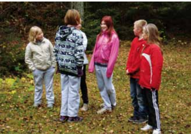
● "Tuletko kanssani taivaaseen?"