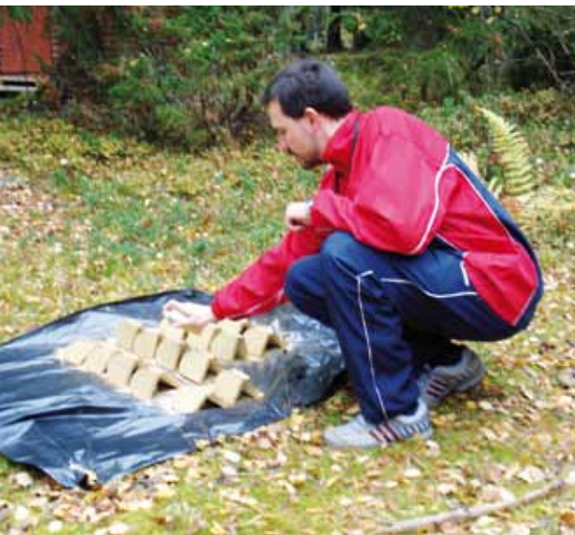
● Ikonipohjien kultaus.