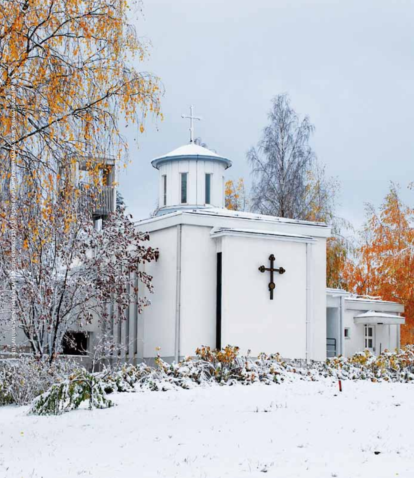
LINTULAN LUOSTARIN PYHÄN KOVIMÄKÄRÄIDEN KIRKKO TAMAN TALVEN ENSILUMEN KORISTAMA. KUVA: MUNNA EMMIGELIA

HAMINA 2–4, HÄMEENLINNA 4–7, KOTKA 8–9, LAHTI 10–13, LAPPEENRANTA 13–18, TAMPERE 18–21, TURKU 21–24