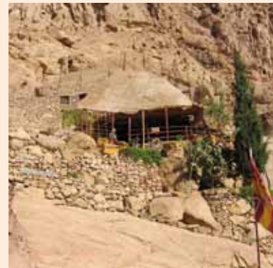
■ Erakkomaja laaksosta nähtynä, terassilla beduiinipalvelija.