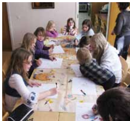
■ Piirtäminen rauhoitti hetkeksi.