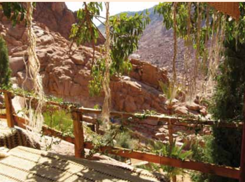
■ Näkymä erakkomajalta laaksoon.

Emme silti ole täydellisiä, vaikka meillä olisi pari kolme oikeaa asennetta. ”Jumalan tie on vailla loppua”, totesi jo Gregorios Nyssalainen. Jumalan tiehen ei väsy koskaan, sillä noustessamme korkeammalle aina avautuu uusia näköaloja. Aadam ja Eeva menettivät hengellisen ilon asettuessaan Jumalaa vastaan. Meidän tulee varoa, miten käytämme pyhät lahjat. Jumala ohjaa meitä oikeaan. Mooses