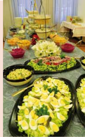
■ Sovintosunnuntain blinit