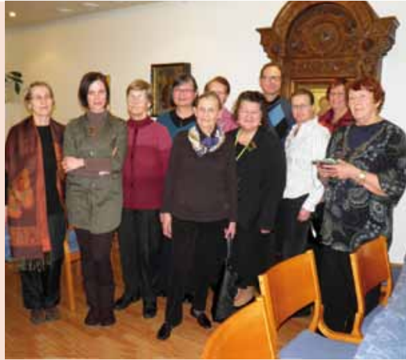
■ Pyhän Nikolaouksen kirkon kuoron uusia ja entisiä laulajia.