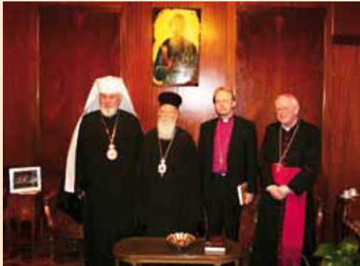
■ Suomalais-piispat patriarkka Bartolomeoksen vastaanotolla.