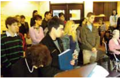
■ Maarianhaminassa toimitetaan nykyisin liturgia neljä kertaa vuodessa. Erityisesti maahanmuuttajat ovat osallistuneet ahkerasti palveluksiin. Maaliskuussa toimitetussa palveluksessa oli yli 40 osallistujaa, eli lähes yhtä paljon kuin seurakunnan jäseniä on Ahvenanmaan alueella.