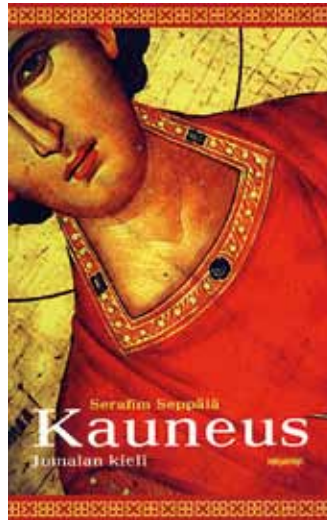
Serafim Seppälä, Kauneus – Jumalan kieli. Kirjapaja 2010, 263 sivua.

Uusplatonisti Plotinos on tuottanut kiin-