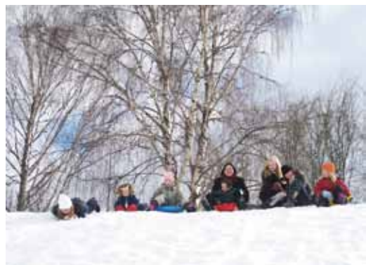
■ Lähtölaskenta alkoi 12.3. Kaurialan kentän pulkamäessä, laskulupa annettu mukavan yhteisen viikonlopun lasten ja nuorten kanssa.