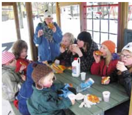
■ Ulkoilmassa maistuu aina välipala.