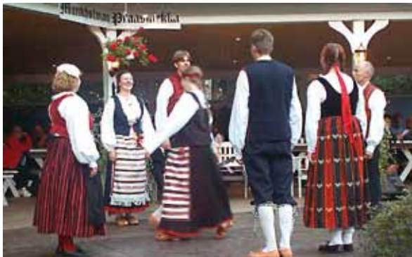
■ Munkholman praasniekassa esiintyjä.

pääkirkon peruskorjaushankkeen tiedottaja