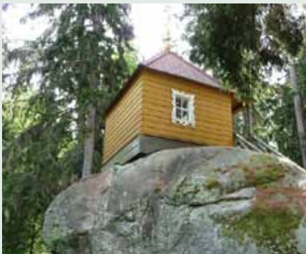
■ Hevoskiven tsasouna.

M uoin Konevitsassa eli Konnon saarella laidunnettiin kesäisin kotieläimiä. Joka kevät kookkaan siirtolohkareen päällä uhrattiin hevonen. Kun pyhä Arseni vuonna 1392 saapui saarelle, hän pyhitti paikan Hevoskiveksi ja rakennutti sen