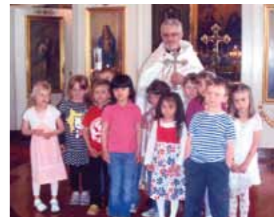
■ Syksyllä 2011 koulunsa aloittavat oppilaat siunattiin koulutielle.