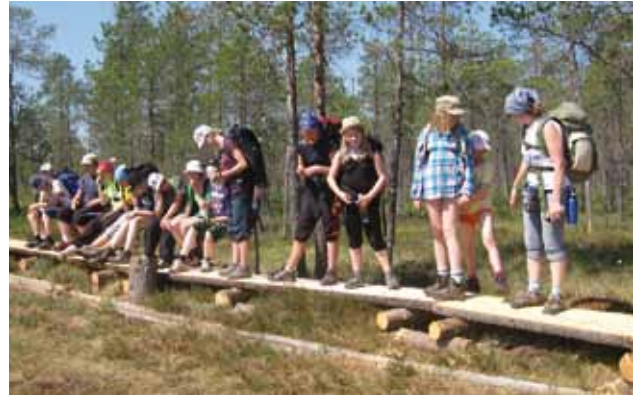
■ Pitkospuilla patikoitiin Valamosta Lintulaan.