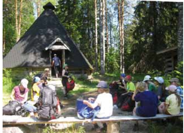
■ Pääkohteenamme oli osallistua helluntaina Lintulan praasniekkaan.