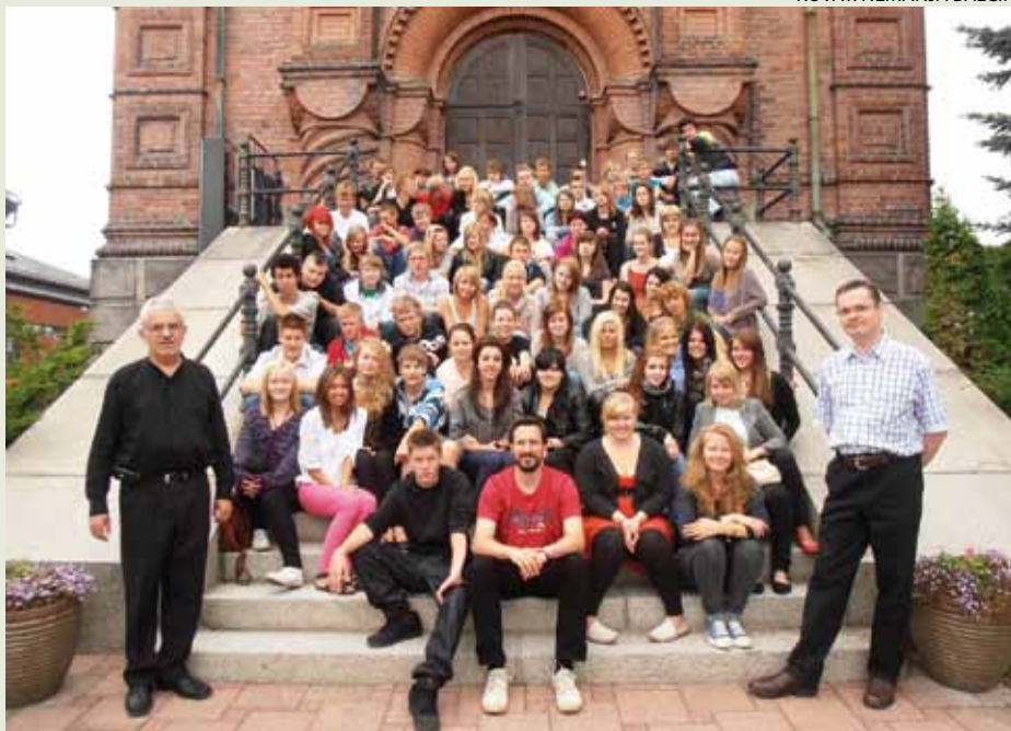
■ Tampereen kirkon edessä