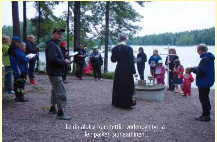
Leirin aluksi toimitettiin vedenpyhitys ja leiripaikan siunaaminen.