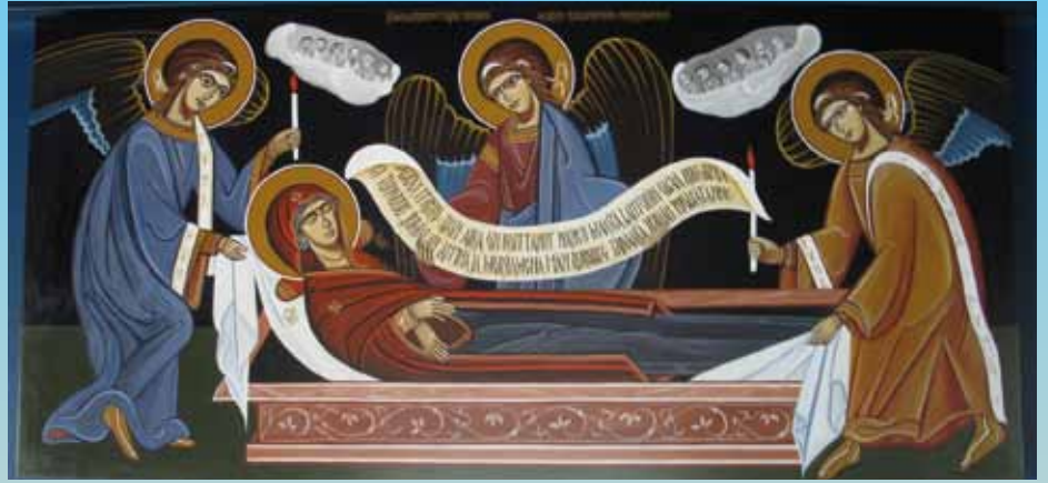
■ "Jumalanäidin kuolonuneen nukkuminen" -ikoni Valtimon kirkossa.