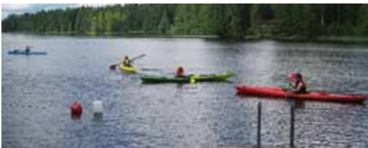
■ Leirillä oli vuokratuna neljä kajakkia, jotka olivat kovassa käytössä.

perheleiri Mallinkaisten leirikeskuksesta 12.-14.7. Janakkalassa.