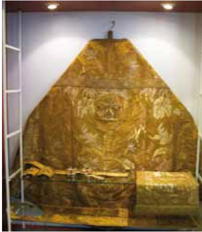
■ Uusi näyttely Nikolaossalilla. Tekstiilejä ja kirkollisia esineitä vuosilta 1798-1902.