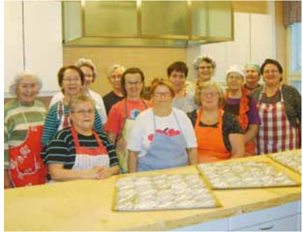
■ Iloinen vapaaehtoisten joukko piirakkatalkoissa Nikolaos-saliilla.