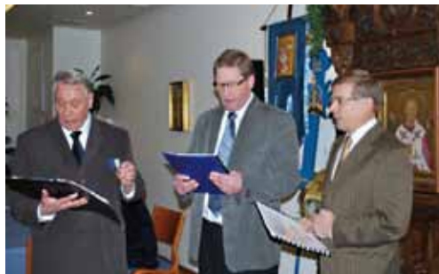
■ Rönkyjät esiintymässä Nikolaos-salilla. Ryhmä vieraillee vanhainkodeissa ja eri laitoksissa seurakunnan tilaisuuksien ohella.