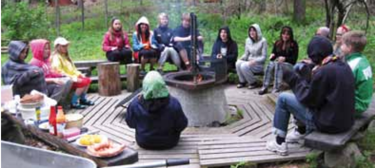
■ Mäntysalon kämpällä rentouduttiin iltanuotion äärellä.