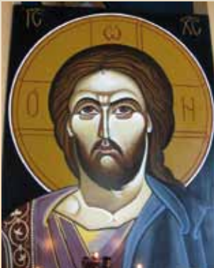
■ "Kristus tulinen katse" -ikoni.