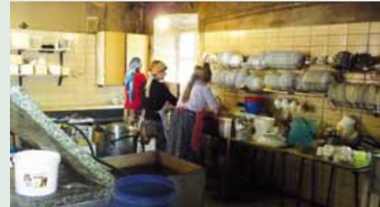
■ Vapaaehtoistyöntekijöitä luostarin keittiössä.

■ Konevitsan saari on viisi kilometriä pitkä ja kolme leveä. Keskisen Karjalan kannaksen Pyhäjärven kunnan Sortanlahdesta on seitsemän kilometriä vesitse Konevitsaan.