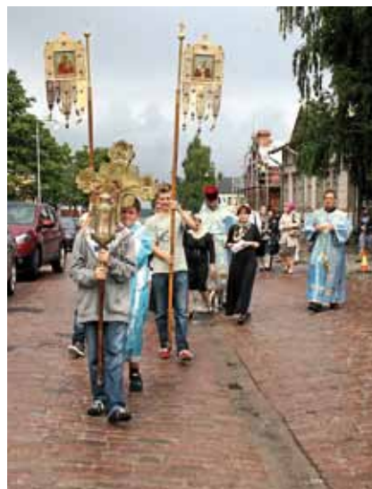
Ristisaatto Lappeenrannan linnoituksessa menossa vastaanottamaan Jumalanäidin ikonin.