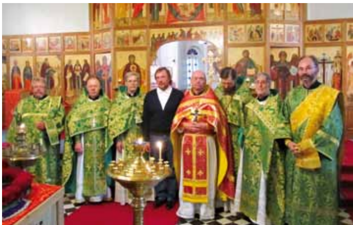
■ Kouvolan Pyhän ristin kirkon vuosijuhlaan osallistuva pappis.