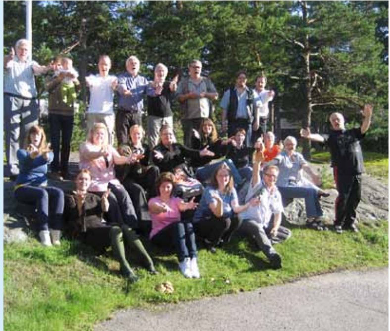
■ Tampereen kirkon kuoro.