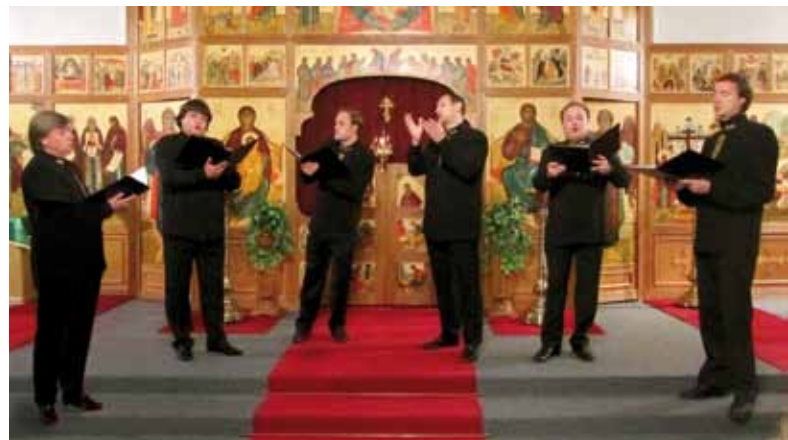
■ Optinan luostarin Pietarin edustuston kuoron konsertti Pyhän ristin kirkossa 12.9.2011.