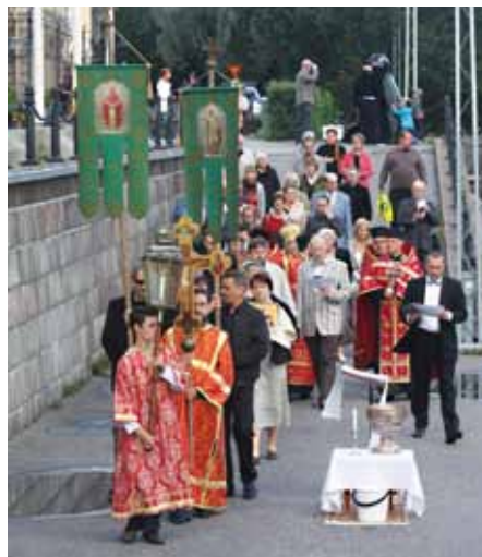
■ Ristisaatto saapumassa Aurajoen rantaan.