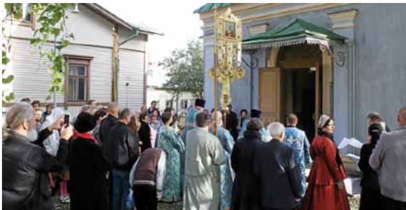
Lappeenrannan Pokrovan kirkon praasniekan vedenpyhitys toimitettiin aurinkoisessa säässä kirkon edustalla.