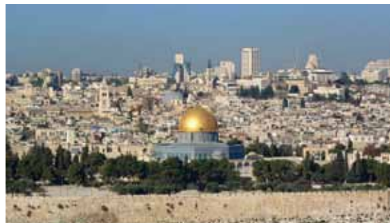
Vastuullinen matkanjärjestäjä Matkatoimisto Artos