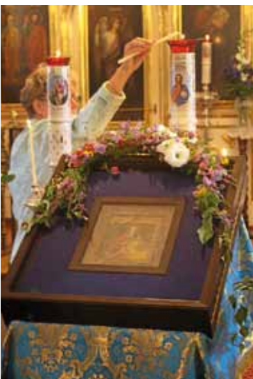
Jumalanäidin Kozelshanskajan ihmeitä tekevä ikoni Lappeenrannan kirkossa.