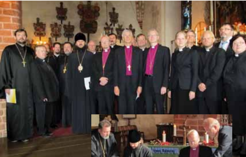
■ Suomen evankelis-luterilaisen kirkon ja Venäjän ortodoksisen kirkon teologiset oppikeskustelut pidettiin Lahden ev.lut. seurakuntayhtymän Siikaniemen kurssikeskuksessa 5.-11.9.2011. Kekustelut päättyivät 11.9. Hollolan Pyhän Marian kirkossa pidettyyn jumalanpalvelukseen ja asiakirjojen allekirjoittamiseen.