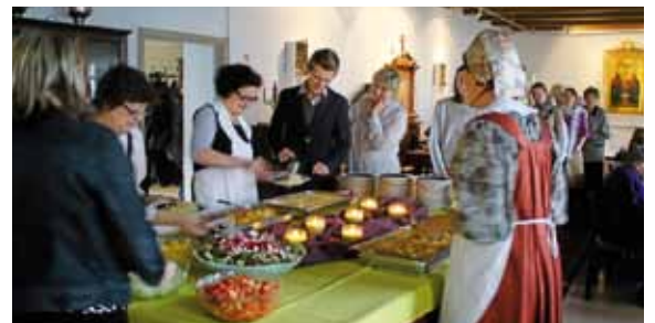
Tiistaiseurallaiset laativat juhlanan praasniekka-aterian koko kirkkokansalle.