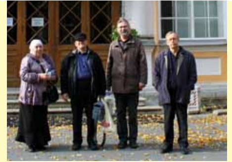
Matkalaisia Pietarin hiippakuntakeskuksen edessä.

nin Jumalanäidin ikonin kirkko ja seurakunta, joka on rakennuttanut lähistölle varsin korkeatasoisen seurakuntakeskuksen. Sen tiloissa on seurakunnan juhlasali, mutta myös erinomaiset tilat lasten ja nuorten seurakuntakoululle, joka toimii aktiivisesti.