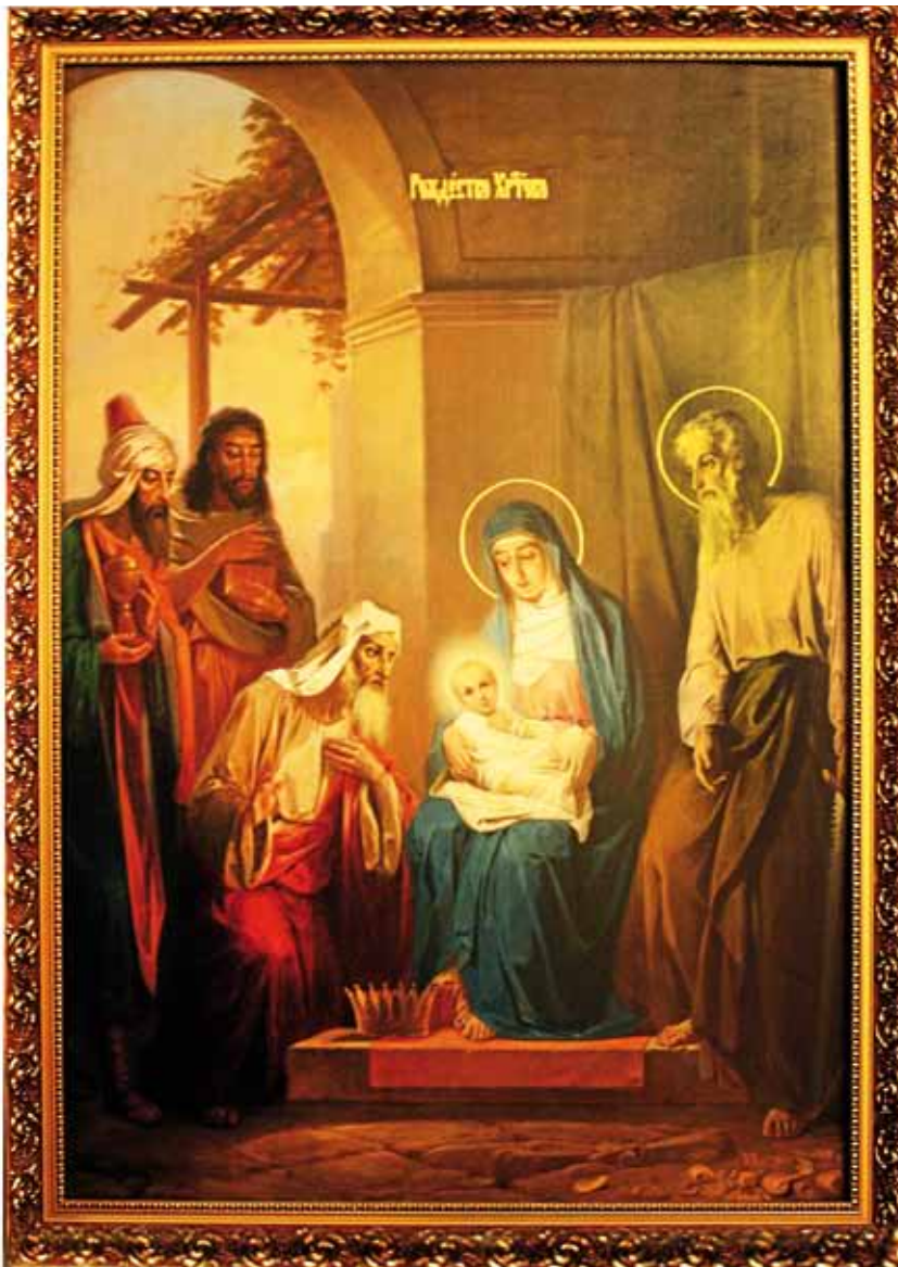
■ Kristuksen syntymäjuhlan ikoni Lappeenrannan kirkossa.

eurooppalaisesta näkökulmasta katsottiin symboloivan tietäjien itäisyyttä. Perinteisissä jouluikoneissa tietäjät kuvataan taustalla saapumassa Kristuksen luo joko kävellen tai hevosilla ratsastaen.