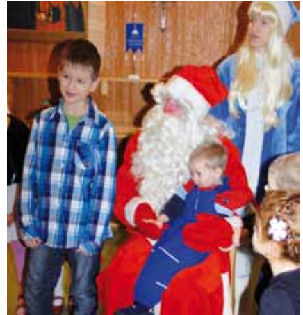
■ Joulupukki vieraili joulujuhlissa tuomassa lapsille lahjoja.