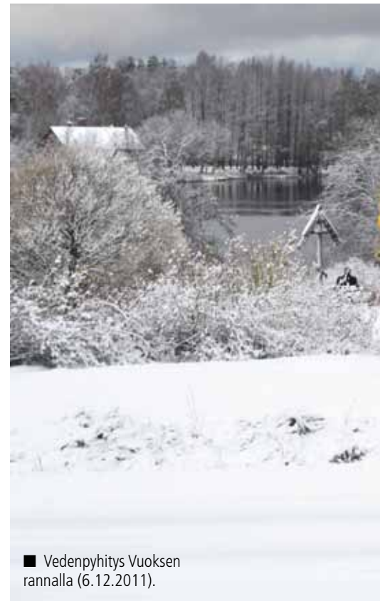
■ Vedenpyhitys Vuoksen rannalla (6.12.2011).