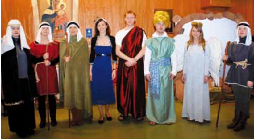
■ Kerhonohjaajat olivat tehneet lasten joulujuhlaan joulukuvaelman.