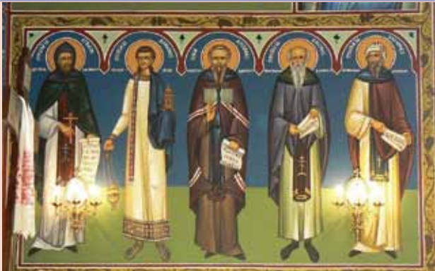
■ Kirkossa vietettiin pyhän Nikolaoksen juhlaa 6.12.2011.