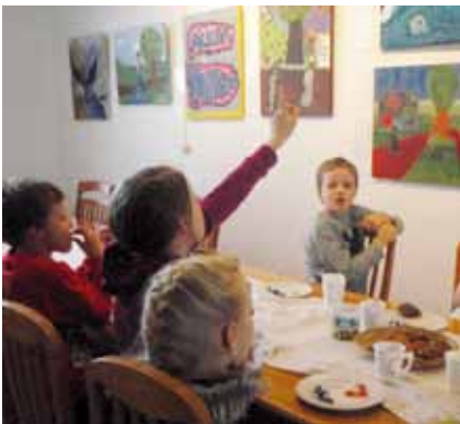
■ Riihimäen toimitilassa Mineassa on esillä Riihimäen lastentaidekoulun oppilaiden raamatunaiheisiin liittyviä töitä. Riihimäen alakoulujen ortodoksioppilaat kävivät tutustumassa esillä-oleviin teoksiin.