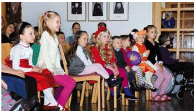
■ Venäjänkielinen lasten joulujuhla pidettiin seurakuntasalilla.