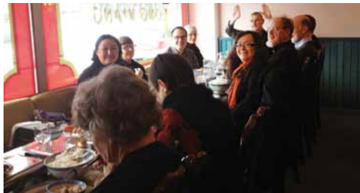
■ Hyvinkään kirkkokuoro järjesti perinteisen lounaan teofaniajuhlan yhteydessä.