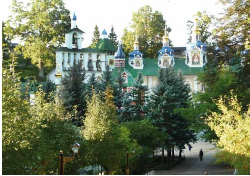
■ Petserin luostari aamuauringossa. Pihkovan tuntumassa ja laaksossa sijaitseva yhteisö säilyi väkivaltakoneistojen kurimukselta. Siellä ovat vierailleet Jeltsinistä lähtien kaikki Venäjän valtaapitävät. Uuden Valamon entisiä veljiäkin on haudattu katakombeihin.

Papisto saa tulonsa kirkkoväeltä suorittamistaan toimituksista. Esirukouksista hautajaisiin on kaikki julkisesti hinnoiteltu. Venäjän ortodoksisella kirkolla on Moskovan lähellä kaksi suurta tehdasta, joissa valmistetaan sakraaliesineitä, kirkkoasuja ja muuta uskonnollista välineistöä sekä tarvikkeita. Jälleen-