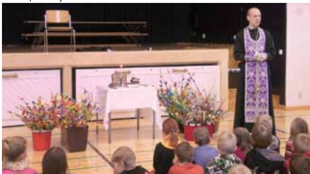
■ Virpovitsojen siunaus.