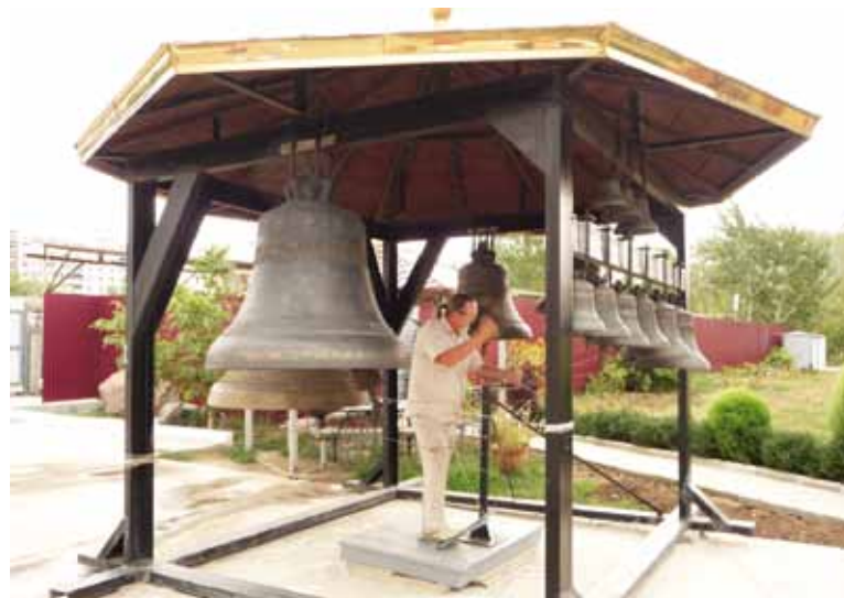
■ Putinin lahjoittama kellotapuli Volgodonskin katedraalin edustalla.