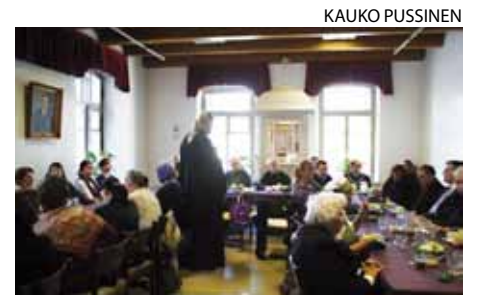
■ Seurakunnan tarkastuksen päätti yhteinen ateria Lappeenrannan seurakuntasalissa.