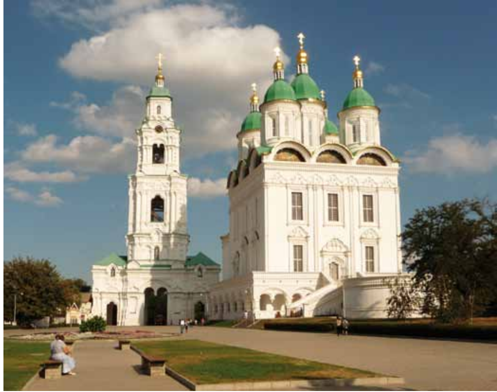
■ Astrakanin ortodoksinen kirkko paikallisen Kremlin sisällä. Jaroslavlilainen maallikkoarkkitehti on suunnitellut 1700-luvulla. Alakirkko on georgialaisten ja yläkirkko venäläisten! Kirkon edessä olevalla korokkeella suoritettiin muinoin mestaukset.

Edesmennyt Moskovan patriarkka Aleksii II aloitti kirkon rakentamisbuumin. Valtio on palauttanut kirkon ja seurakuntien käyttöön kiinteistöjä ja maata, mutta itse ne on saatava toimiviksi. Kirkon omaisuus ei ole Venäjällä selkeä käsite. Kun kirkon väki koetti saada Tretjakovin