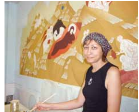
■ Kirkkotaiteilija kuuliaisuus-tehtävässään Volgodonskin katedraalissa.

Taloudellinen valta on vahvasti keskitetty harvojen käsiin Moskovaan. Jopa Kas-