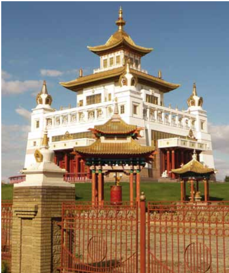
■ Kalmukkien tasavallan pääkaupungin Elizan mahtavin rakennus on Buddhan temppeli.