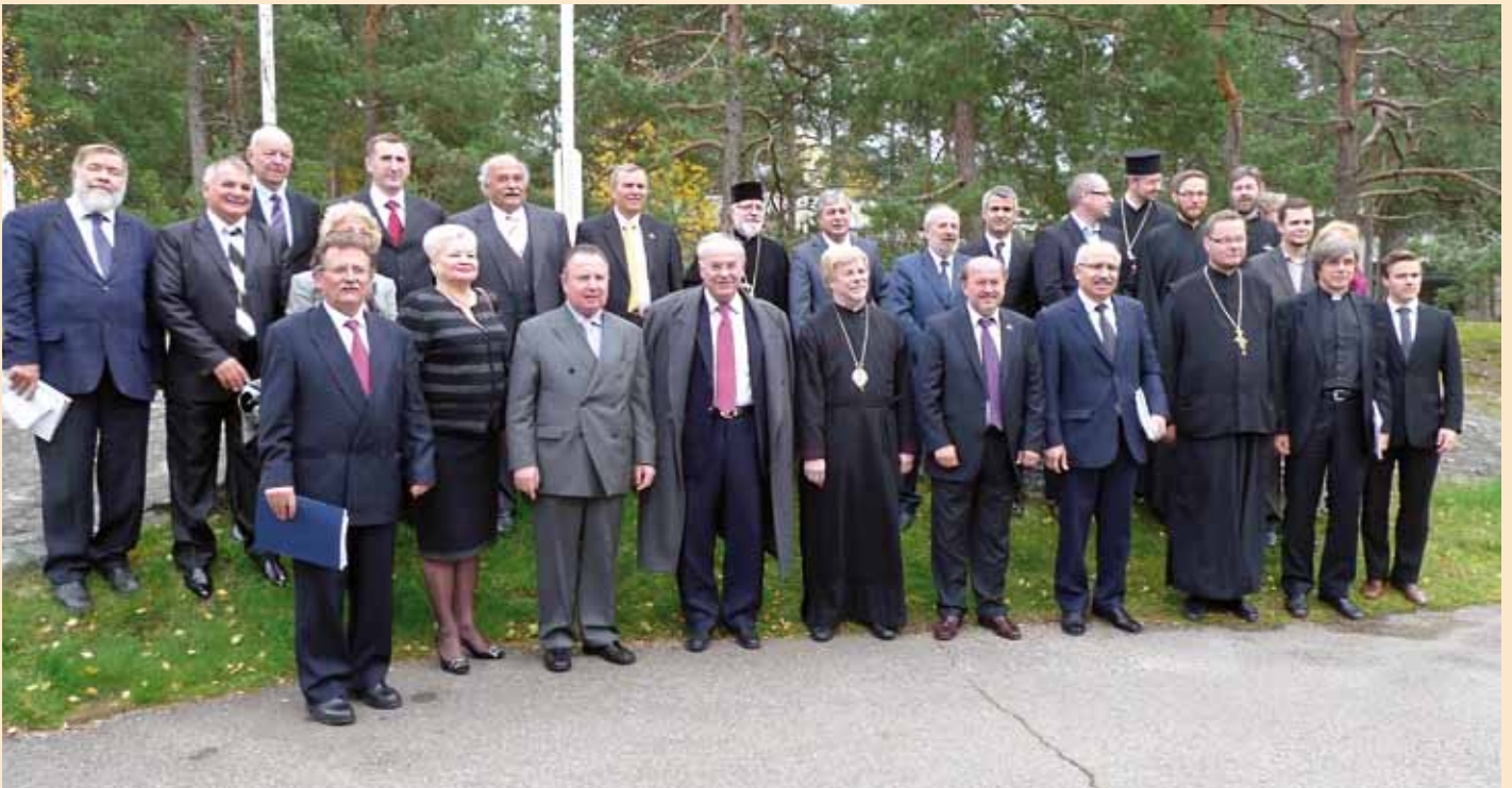
■ Kokousedustajat ryhmäkuvassa.