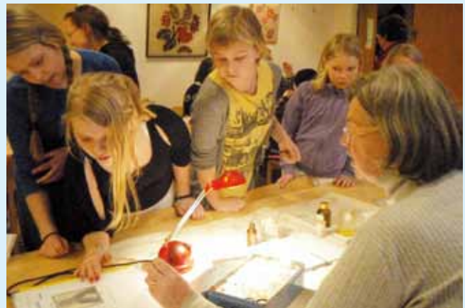
■ Leiriläiset pääsivät tutustumaan ikoninmaalauksen saloihin