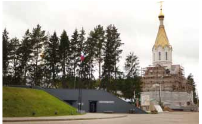
■ Sisäänkäynti hirvittävään Katynin metsään.