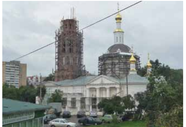
■ Kirkkojen jälleenrakennusbuumia ja kultaisia kupoleita lähellä Kurskia.