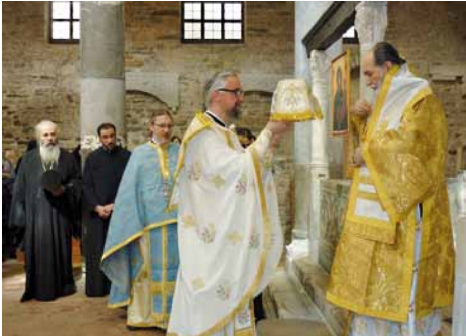
■ Pyhän Eufemian kirkossa toimitettiin metropoliitan johdolla ortodoksinen liturgia.

muun muassa apostoli Markuksen, pyhän Lucian ja pyhän Johannes Laupiaan reliikit. Kaupungin historiaan liittyvä Hyvän Terveiden Madonna on bysanttilainen ikoni. Venetsialaiset toivat sen Kreetalta vuonna 1670 kirkkoon, jonka he olivat rakentaneet 1630-luvulle riehuneen noin 600 000 uhria vaatineen rutan päättymisen muistoksi. Sitä juhlitaan näyttävästi joka vuosi Neitsyt Marian temppeeliin käynnin juhlanäytöksinä 21. marraskuuta.