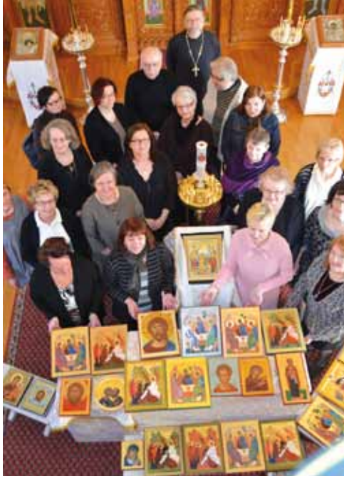
■ Imatralaisia ikonimaalareita uusine töineen Nikolaoksen kirkossa.