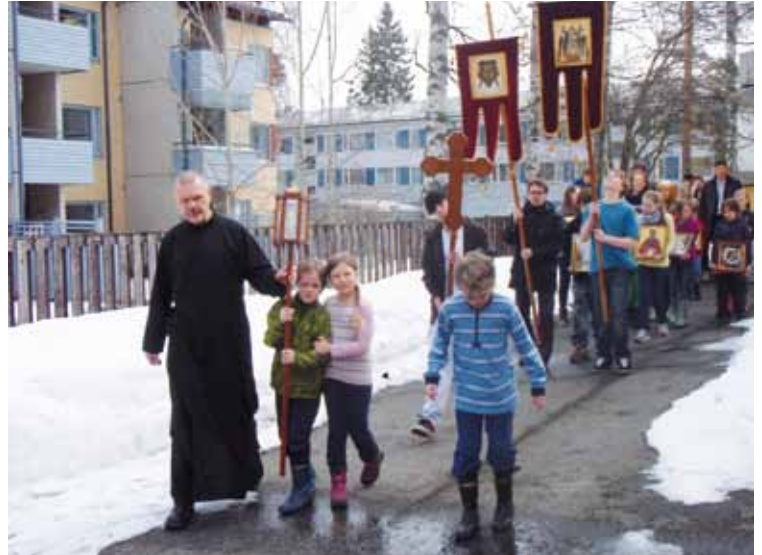
■ Jokaisella ikään katsomatta, oli oma tehtävänsä Hyvinkään koululaisliturgian ristisaatossa. Kristus nousi kuolleista!