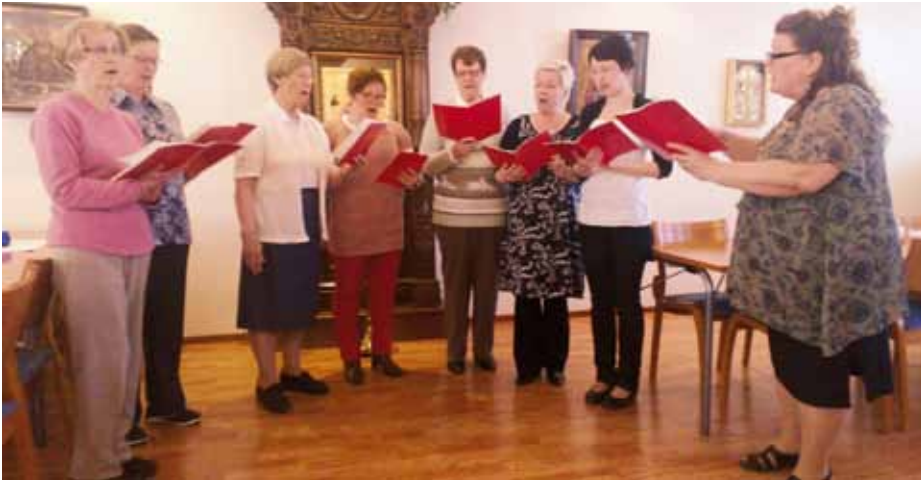
■ Runo- ja lauluillassa esiintyivät kirkkokuoro ja lasten musiikkikerho.