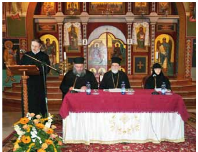
■ Luostarin järjestämä seminaari.

Eufemian kirkossa toimitettiin metropoliitan johdolla ortodoksinen liturgia ensimmäisen kerran tuhanteen vuoteen! Venetsiassa me seminaarin ulkomailta tulleet osanottajat viivyimme koko päivän. Meitä kiinnostivat etenkin kallisarvoiset pyhänjäänökset, joita venetsialaiset olivat valtansa päivinä keränneet eri puolilta Välimeren rantaan kaupunkiinsa. Siellä on