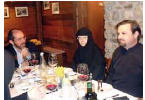
■ Luostarin ateriolla käytiin hengellisiä keskusteluita.

Paitsi itse seminaarissa kävimme luostarin ateriolla hengellisiä keskusteluita. Vallitsi alkukirkollinen sydämen yksinkertaisuus ja lempeä leppoisuus. Tuli mieleeni, että meidän vähemmistöinä elävien ortodoksien pitäisi kokoontua keskenämme useammin. ”Diasporalaisten” tapaami-