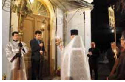
■ Pääsiäisyön aamupalveluksen alku Lappeenrannan kirkon edustalla täydenkuun loisteessa.