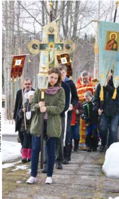
■ Koululaisjumalanpalveluksen risti-saatto Imatralla.