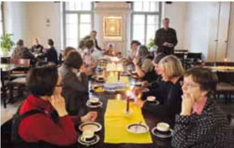
■ Lappeenrannan ikonimaalarit kauden päättäjaiskavhilla ikonien siunauksen jälkeen.