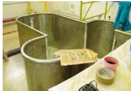
■ Kasteastiat valmistetaan Venäjällä tarpeen mukaan. (Volgodonsk)

Noin 70–80 prosenttia venäläisistä sanoo itseään ortodokseksi, mutta vain alle prosentti käy kirkossa edes kerran