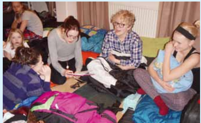
■ Leirielämää ei voita mikään!