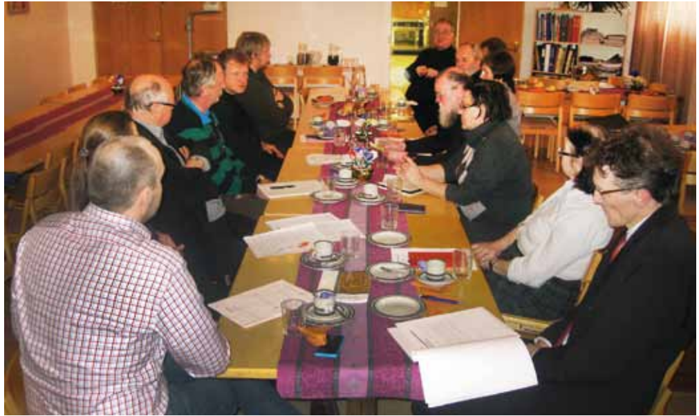
■ Seurakunnan suunnittelukokouksesta.