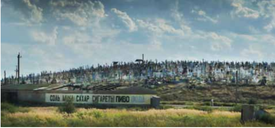
■ Venäläinen hautausmaa mustan mullan alueella.

Galleriassa säilytettävää ortodokseille pyhää Pyhän Kolminaisuuden kultti-ikonია kirkolliseen käyttöön, niin museoväki luikerteli ongelmasta rakennuttamalla gallerian sisätiloihin kotikirkon, jolloin ikoni on kirkon alueella.