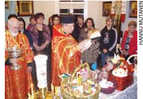
■ Pääsiäisruokien siunaus Imatran kirkon pääsiäisyön jumalanpalveluksessa.