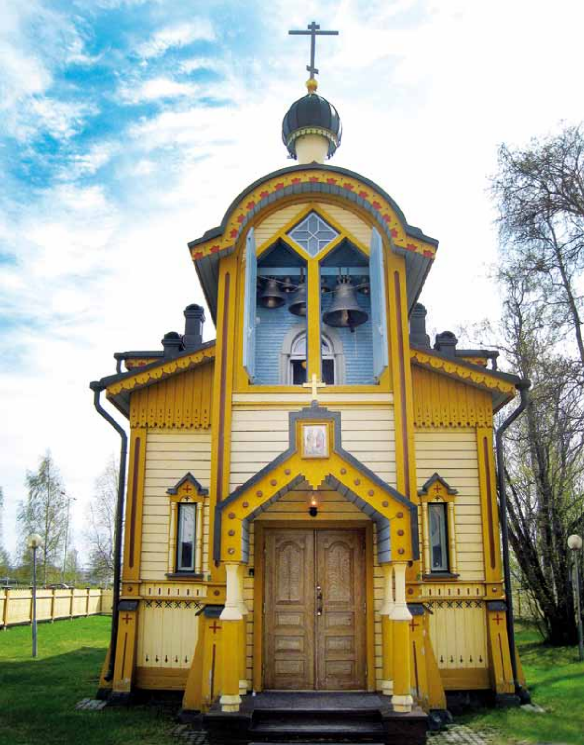
PYHIEN APOSTOLIN PIETARIN JA PAAVALIN KIRKKO TORNISSA, ALUNPERIN VENÄJÄINEN SOTILASKIRKKO. NYKYISIN SIELLÄ KÄY PALVELUKSISSA TORNION JA LÄHIKUNTIEN ORTODOKSIEEN LISÄKSI IMYÖS NAAPURIMAAN RUOTSIIN ORTODOKSEJA.

HAMINA 2–3, HÄMEENLINNA 3–6, KOTKA 6–8, LAHTI 8–11, LAPPEENRANTA 11–16, TAMPERE 17–21, TURKU 21–23